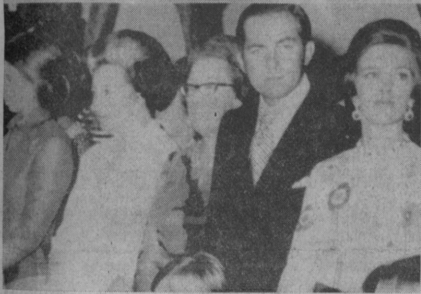
Sevilla.—Arriba, el príncipe Alejandro de Yugoslavia y la princesa María Gloria de Orleans con el obispo ortodoxo. Abajo, la reina Ana María de Grecia y su esposo el rey Constantino; les sigue la princesa Esperanza de Borbón Orleans, madre de María Gloria Orleans, la condesa de Barcelona y la princesa Ana de Inglaterra.