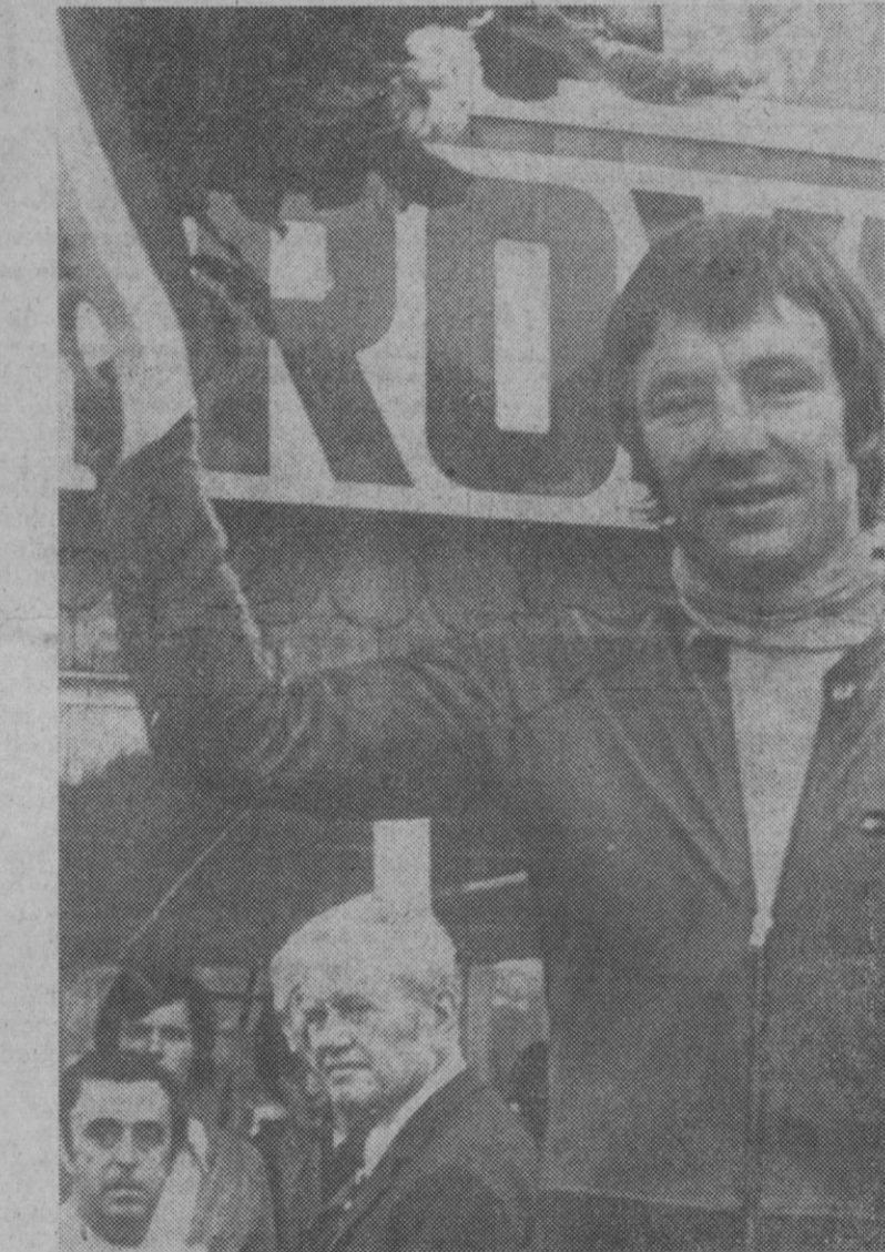
Francorchamps.—Angel Nieto, corriendo en gran campeón, se adjudicó las pruebas de 50 y 125 cc. del gran premio de Bélgica, con lo cual consolida aún más su situación en la clasificación para el campeonato mundial.

El francés Cyrille Guimard vestía el maillot amarillo de líder del «Tour» y, sonriente, posó para los fotógrafos momentos antes de darse la salida, junto a Eddy Merckx.