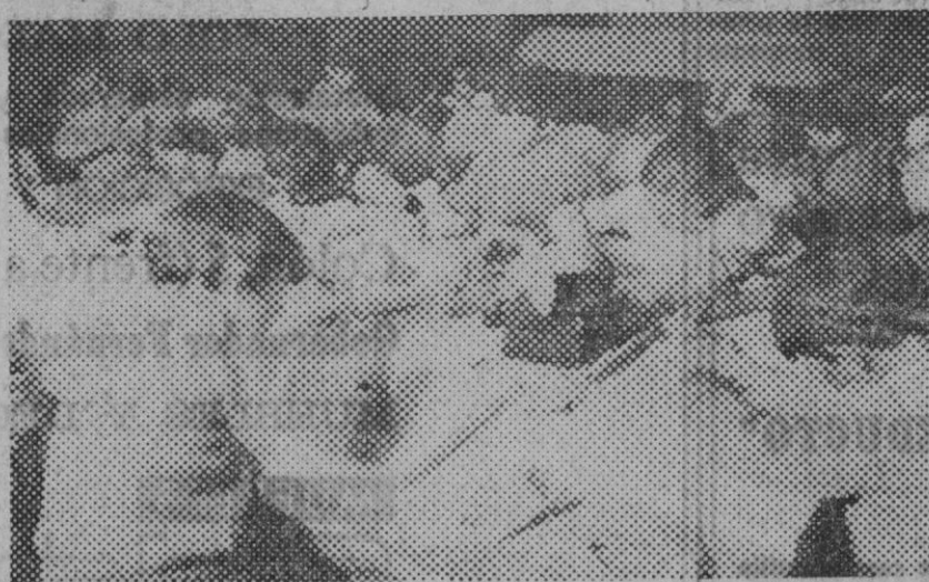
Por ejemplo, en esta Escuela de Bellas Artes, las Cajas de Ahorros, con la colaboración de Usted, descubren y fomentan las aptitudes de los españoles.

Sus pagos y cobros, particulares o de empresa, llegan con urgencia si Usted usa las transferencias de las Cajas de Ahorros. Y es natural. La coordinación de sus 5.500 Oficinas suprime trámites y esperas. Por carta puede dar a su Caja órdenes de pago, o comunicar a sus deudores que le hagan sus liquidaciones a través de ella. No cabe más dinamismo • Las Cajas de Ahorros Confederadas se distinguen fácilmente. Porque ofrecen: transferencias, domiciliación de pagos, cheques de viaje, cambio de divisas, custodia de valores, etc., en sus 5.500 Oficinas destinadas sólo a servicios financieros • Por este emblema • Porque su Consejo de Administración trabaja desinteresadamente. Gratis. Y no tienen accionistas. Entonces, sus beneficios no van a bolsillos particulares, sino a centros de investigación, clínicas, bibliotecas, premios literarios, campos deportivos, becas, restauraciones..., (4.000 millones se destinaron a estas obras el año pasado).