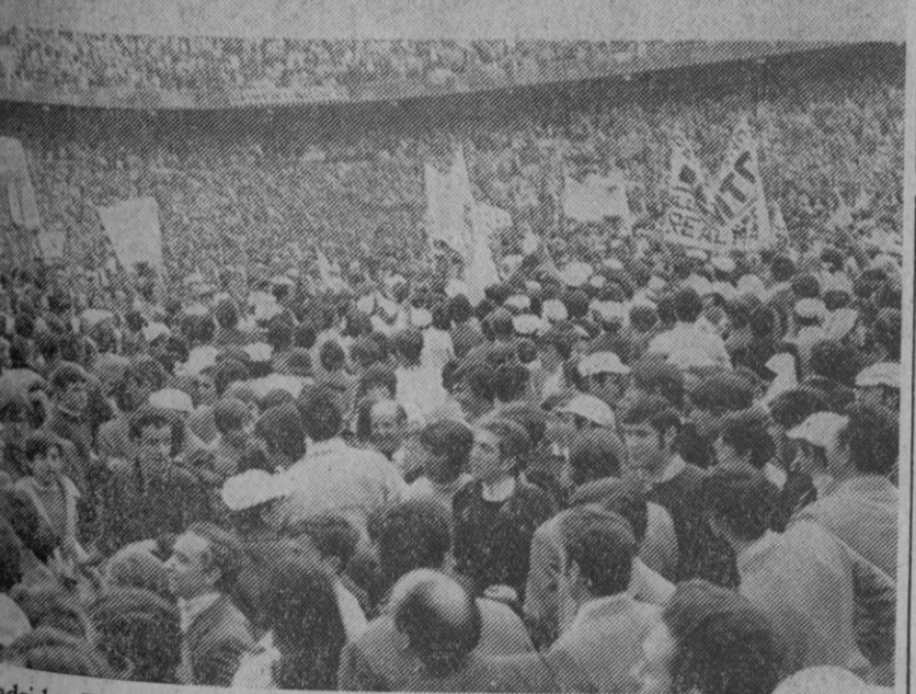
Madrid.—Tras su victoria por 4-1 contra el Sevilla, el Real Madrid, se proclamó campeón del torneo de Liga, del que fue líder desde la segunda jornada. Las peñas de aficionados tributaron un gran homenaje al equipo.