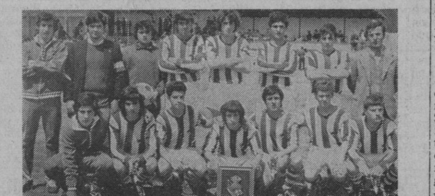
La Real Sociedad, subcampeón.

ron ser adversas al deporte. La Delegación Provincial de la Juventud, por medio de su sección de actividades deportivas organizadora de estos campeonatos de fútbol infantil, han vuelto a dar una clara lección de saber hacer. Lástima que la lluvia, nieve y frío restase brillantez a las jornadas y al juego de los cuatro equipos cuyo fútbol podemos catalogar de muy bueno.