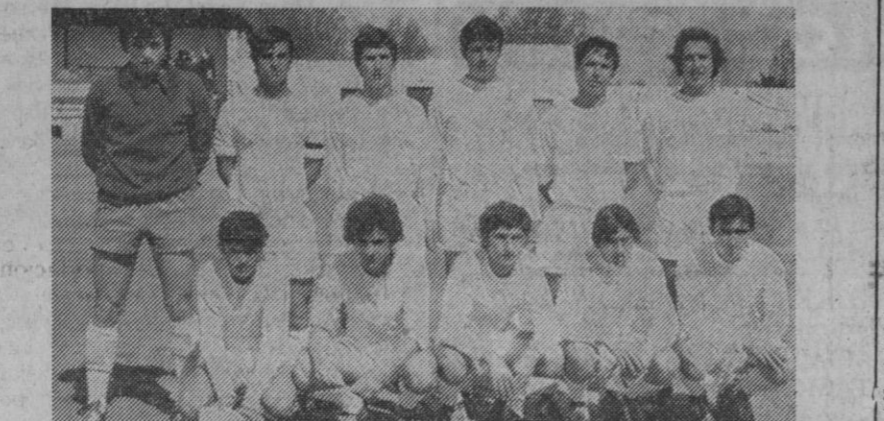
El Real Madrid, campeón.

final—según ordena el reglamento—los corners dieron el derecho a jugar la final a los de la Real Sociedad, mientras que Zorrilla y Claret se enfrentarían por el tercer y cuarto puesto.