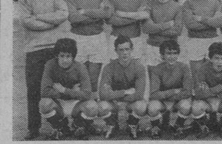
El Zorrilla, tercer clasificado.

de esta forma, el equipo funcionaba bien en la primera mitad, contando además—detalle importantísimo—con un gol de ventaja, lo que les daba mayor tranquilidad para su juego. Por otra parte, el Aranjuez, salvo cuatro o cinco avances llevados muy bien, no hizo más cosas para poner en aprietos a los azulgrana que, a decir verdad, encontraron unos enemigos más inocentes y des-