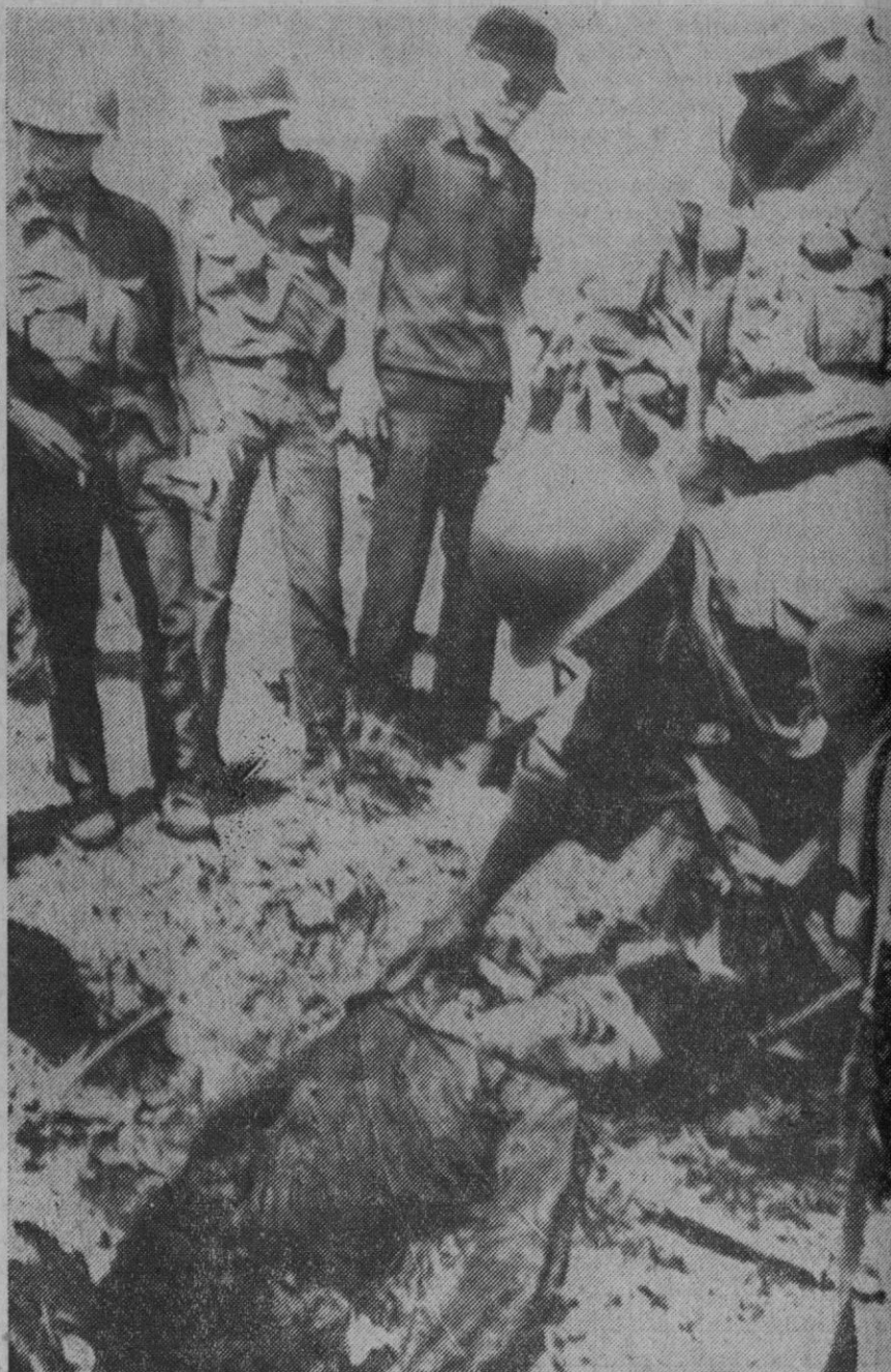
Quang Tri.—Un soldado survietnamita tratando de identificar el cadáver de un enemigo muerto en la carretera número 1, a unos 10 kilómetros al sur de Quang Tri. Esta vía de comunicación es vital para el suministro continuo de tropas y avituallamiento a la nueva línea defensiva.—(Telefoto AP-Europa Press)

Hong-Kong, 6.—La situación militar en Vietnam del Sur es hoy incierta. Contrastando las escasas noticias de los mandos de Hanoi y de Saigón, no puede decirse sino que (Continúa en la página 6)