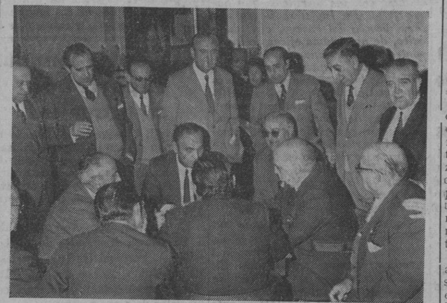
Ayer se celebró en el Casino de la Unión una cena "para hombres solos", con permiso de las señoras, decía la invitación, a fin de proceder a la entrega de los premios a los vencedores de las competiciones de mus y dominó que últimamente se han venido celebrando.