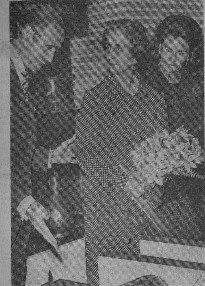
Madrid.—Doña Carmen Polo de Franco, acompañada por los ministros de Industria y de Información y Turismo, ha inaugurado los dos nuevos Mercados de Artesanía.

Terminada la visita, fue obsequiado con una comida en el salón de honor de Instituto al que asistieron, además de las autoridades citadas, el subsecretario del Ministerio de Asuntos Exteriores de España, el embajador de España en Bolivia, el director general de Relaciones Económicas Internacionales y otras personalidades.—Cifra.