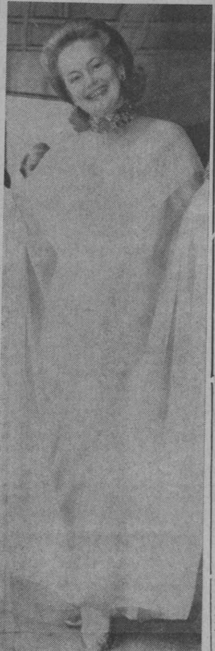
Olivia de Havilland, 55 años, dos maridos, un hijo y una vida tranquila en París. Vive del recuerdo y de las rentas de «Lo que el viento se llevó». Parecida suerte a la de su hermana, Joan Fontaine. Su rostro fue quien la ahogó como actriz, obligada siempre a repetir hasta la saciedad la caricatura de su imagen. Hablan ahora de un posible romance con Edward Heath.

La centenaria vive en Posada de Baldeón, pueblo situado en el valle de los Picos de Europa.