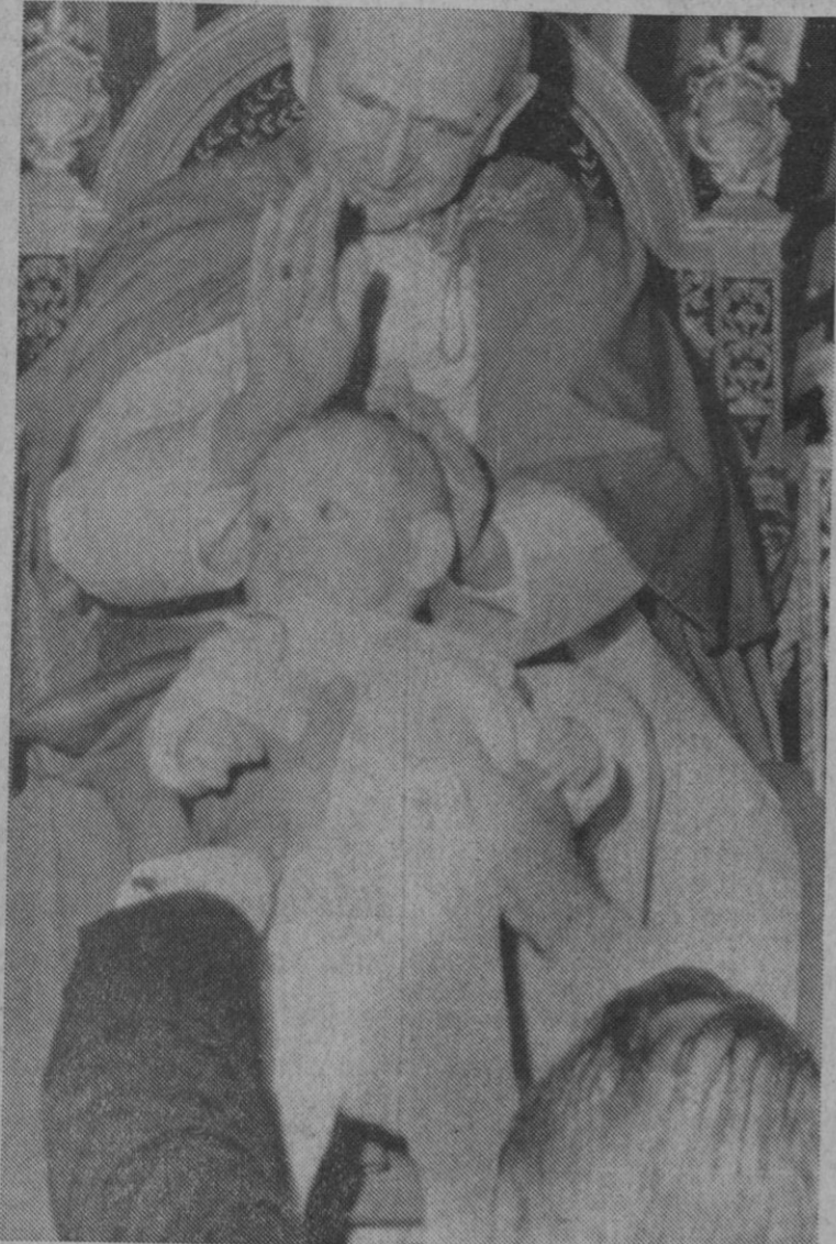
Ciudad del Vaticano.—Un hombre levanta a su hijo hacia Su Santidad el Papa Pablo VI, quien se detuvo para bendecirle y acariciarle, durante la audiencia general que se celebra semanalmente en el Vaticano.—(Telefoto AP-Europa Press)

Whitelaw se trasladará en la tarde de hoy a Belfast en medio de grandes medidas de seguridad.—Efe.