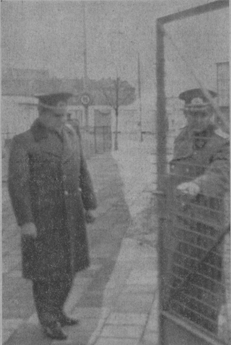
Berlín.—Dos policías de Berlín Oriental abriendo los puestos de control en la muralla berlinesa, con motivo de las fiestas de Semana Santa. La «foto» está tomada en el punto de control de Sonnenalles.

Cielo parcialmente nuboso con grandes claros en las demás regiones. Temperaturas extremas de España: máxima de 24 grados en Sevilla, y mínima de cuatro grados en Bilbao.—Cifra.