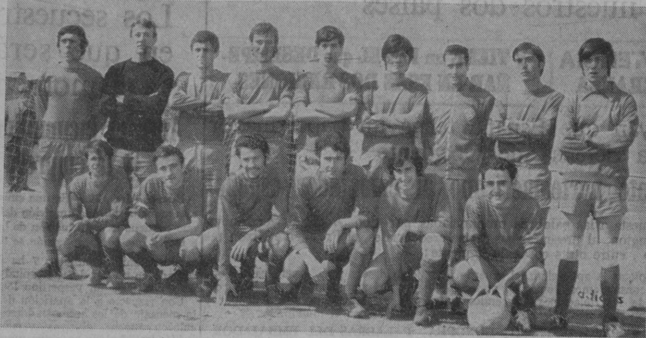
El brillante campeón, C. D. Cuéllar.

En el último partido venció a Aldeamayor por 2-0