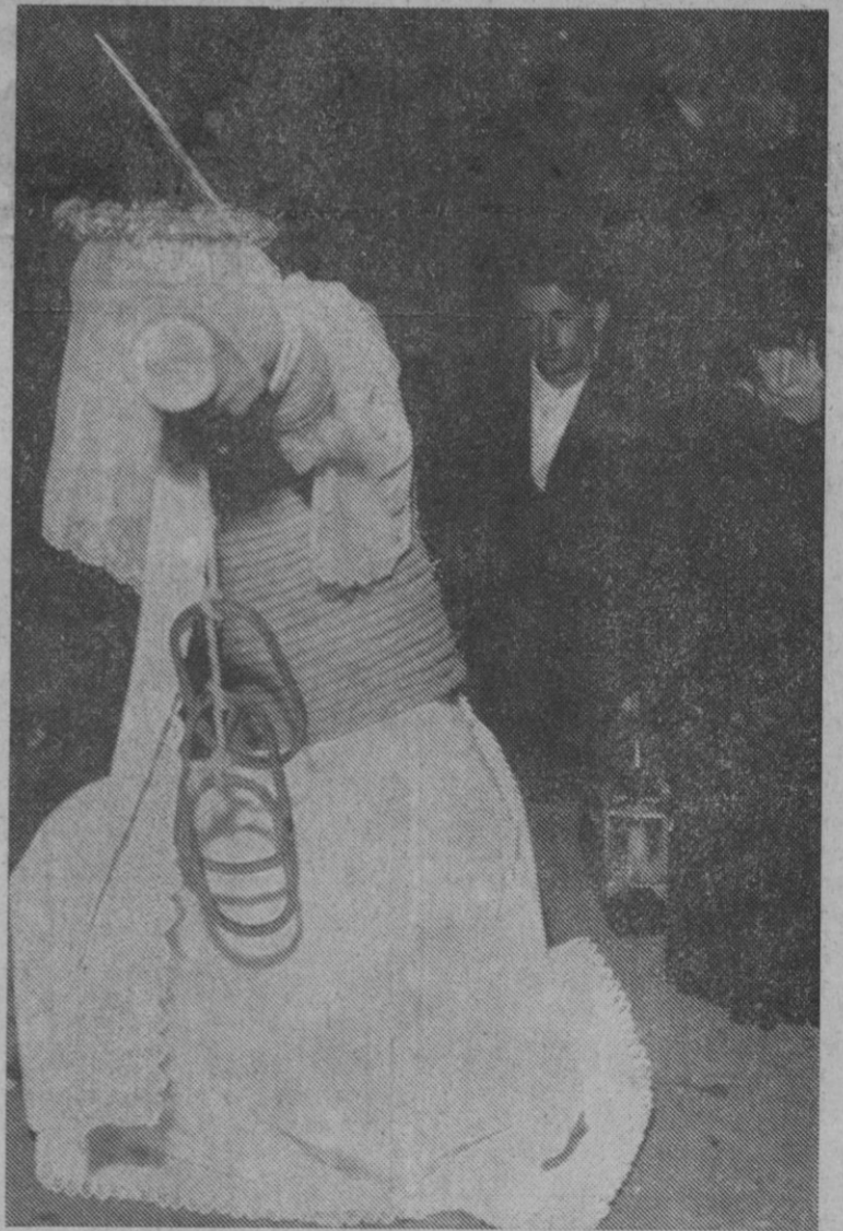
Valverde de la Vers.—En este pueblo de la provincia de Cáceres, se celebra anualmente, en el Jueves Santo, la famosa procesión de los «empalados». Van los penitentes cubierto su cuerpo con una gran cuerda y llevando sobre sus hombros un madero, como puede apreciarse claramente en la fotografía.