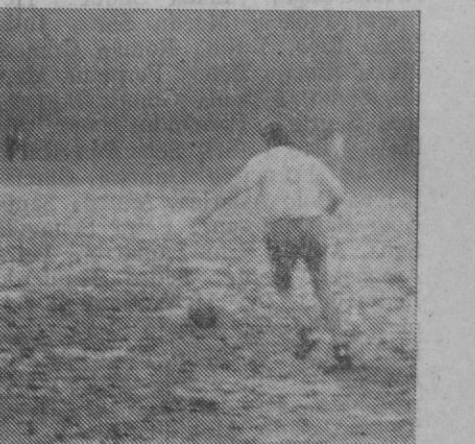
Decidido como en sus mejores tiempos, el alcalde-futbolista se dispone a golpear el balón

bra más. Los dos ejemplos necesitarían de muchos émulos. Y que no se nos enfaden «el señor alcalde» ni «el señor cura» por haber aireado sus actividades «extraprofesionales». Pero ya decimos que sus ejemplos merecen—cuando menos—este pequeño «homenaje» en las páginas de nuestro periódico.