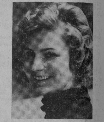
La «princesa» patinadora austriaca Beatriz Schuba, ganadora de una medalla de oro en Sapporo, en patinaje femenino

Para los observadores, este artículo, junto con los recelos expresados ante el viaje de Nixon, demuestra que el temor del Kremlin hacia una aproximación Pekín-