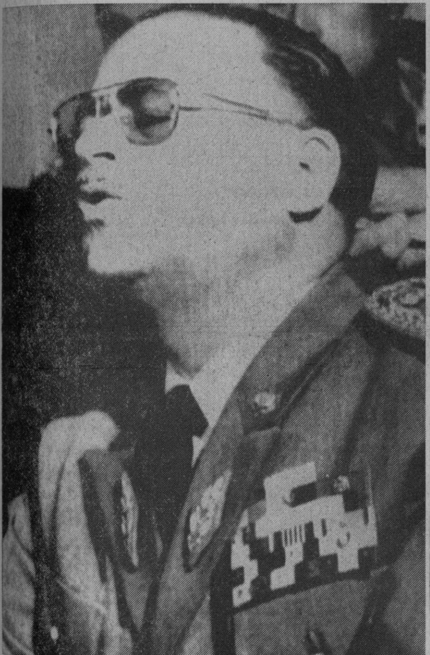
Quito.—El general Guillermo Rodríguez Lara, nuevo presidente del Ecuador, como consecuencia de un golpe militar que derrocó al presidente anterior Velasco Ibarra. El general Rodríguez Lara habla para los periodistas. El general es militar de carrera y se estima que sus puntos de vista en política son ultraconservadores.

Intensa nevada en Seo de Urgel Seo de Urgel (Lérida), 17.—Una intensa nevada se ha precipitado sobre esta comarca durante la madrugada y mañana de hoy, cubriendo todo el Urgellet bajo una capa de diez centímetros de nieve. Esta nevada es la cuarta del año y no ha alcanzado mayor espesor merced a que las temperaturas son bastante suaves.—Cifra.