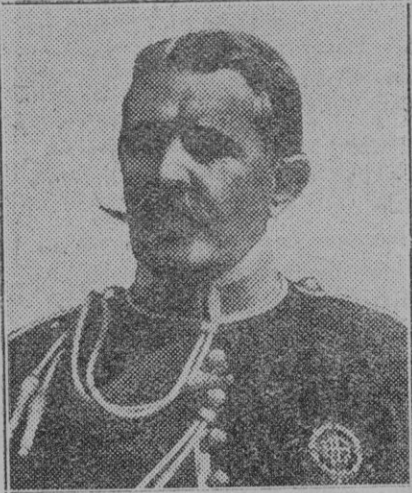
El general Cavaleanti, Capitán General de Andalucía.