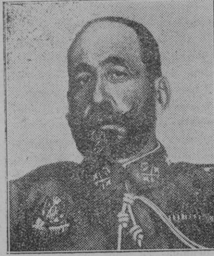
El barón de Casa Davalillos, Jefe de la Casa Militar del Rey.