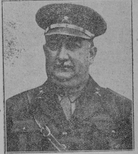
El general don Federico Berenguer, Capitán General de Madrid.