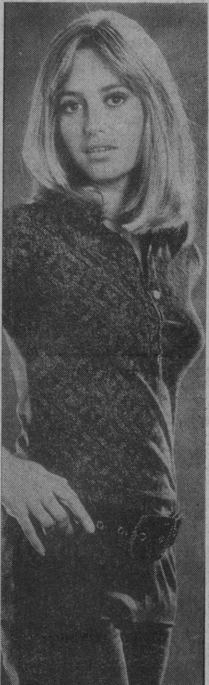
Susan George es una nueva estrella en el cine cinematográfico, con mezcla de Brigitte Bardot, Raquel Welch y Twiggy. Hubo una temporada en la que se dijo que era novia del famoso futbolista George Best. Ahora trabaja con Dustin Hoffmann en «Perros vagabundos».

técnico, desarrollo que ha plasmado ya en la firma de varios acuerdos. Han considerado con detenimiento aquellos sectores en los que la cooperación entre los dos países puede ser intensificada. A este respecto, el próximo día se firmará un acuerdo a largo plazo sobre la compra de gas natural argelino por España y la conclusión próxima de un acuerdo de cooperación económica y financiera entre España y Argelia, muestra la firme voluntad de los dos países de aumentar y diversificar y equilibrar sus intercambios con objeto de intensificar sus relaciones en todos los campos.