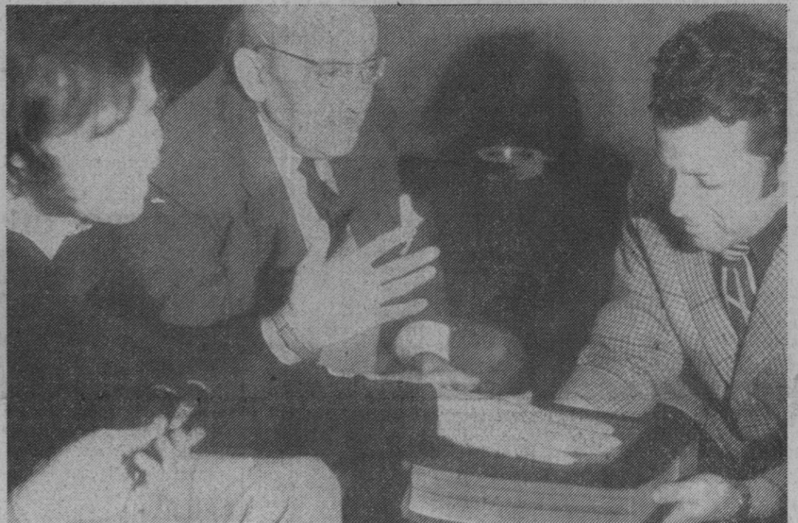
Córdoba.—Después de una ausencia de tres meses, «El Cordobés» aparece nuevamente ante la curiosidad general para jurar sobre una Biblia que no se ha casado, ni ha estado enfermo, ni ha estado en Suiza. ¿Dónde ha estado Manolo?

La delegación china en las Naciones Unidas la componen más de cuarenta miembros, y llegó a Nueva York a mediados del mes de noviembre después de la decisión de la Asamblea General de la ONU de admitir a China dentro del organismo internacional y expulsar de él a Formosa.—Efe-Reuters.