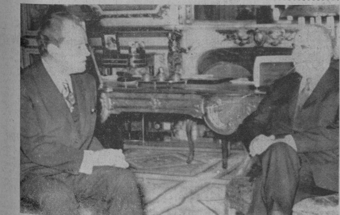
Paris.—El presidente Pompidou, en su despacho, durante su entrevista con Willy Brandt, que llegó a París para una visita de dos días.

Madrid, 11.—La previsión del tiempo para las próximas 24 horas, según el Servicio Meteorológico Nacional, es de cielo cubierto con lluvias en Galicia, Cantábrico, Duero, Centro, Extremadura y cuencas media y alta del Ebro, Chubascos de nieve en puntos de la cordillera cantábrico-pirenaica y de aguanieve en los sistemas ibérico y central. Nubosidad variable con alguna llovizna en Cataluña. Poco nublado en el resto de España. Vientos del Oeste fuertes en la mitad norte de la Península. Temperaturas altas.