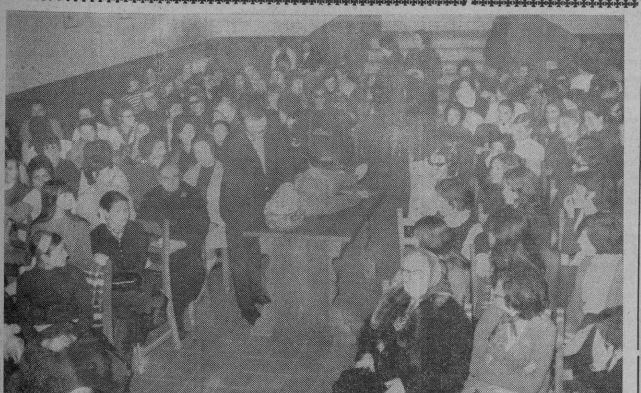
Una de las sesiones que celebra el grupo cultural de mujeres trabajadoras en la sala de actos de Sección Femenina. Corresponde esta sesión a salvamento y socorrismo, pero el programa a desarrollar durante el curso, un día por semana, comprende temas culturales, de orientación, etcétera. Estas sesiones son organizadas por la Regiduría Provincial de Trabajo de Sección Femenina

SOLUCION.—1: Caravasara, c).—2: Iconodulo, a).—3: Macsura, a).—4: Lama, c).—5: Decuso, a).—6: Amarrido, c).