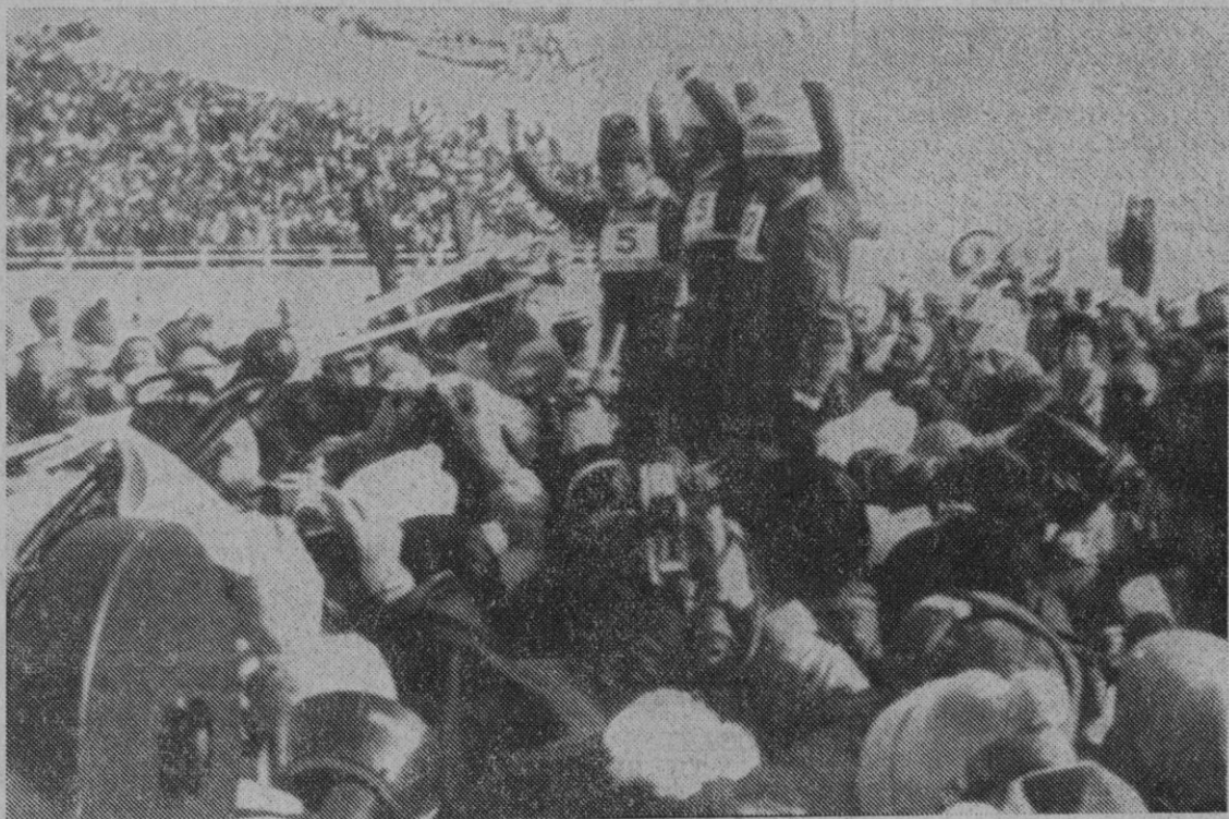
Sapporo.—Tres japoneses coparon los primeros puestos en los saltos de trampolín de 70 metros, lo que representa que Japón gana por vez primera una medalla de oro.