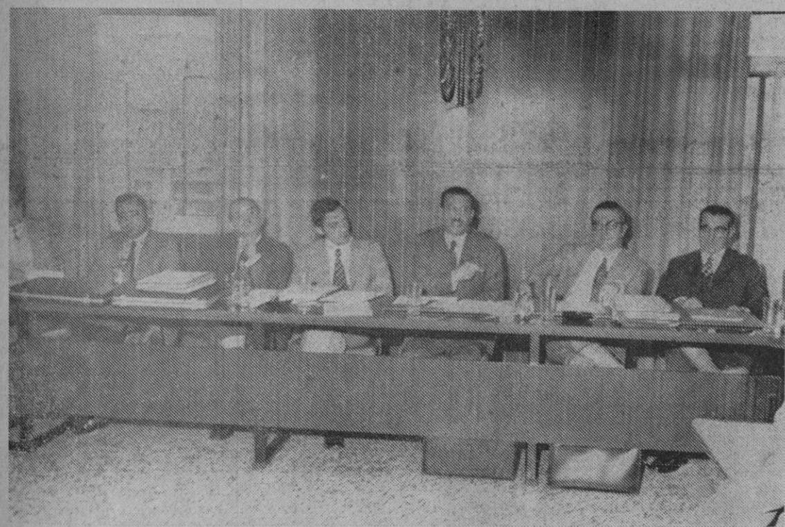
Sesión de apertura, esta mañana, en la Casa Sindical, de la reunión de trabajo para secretarios de Consejos Provinciales de Trabajadores y vicesecretarios provinciales de Ordenación Social de toda España. La reunión se prolongará durante todo el día de mañana. El acto inaugural estuvo presidido por el secretario general del Consejo Nacional de Trabajadores y vicesecretario nacional de Ordenación Social acompañado del delegado provincial sindical y otros cargos nacionales.

Londres, 8.—La Reina de Inglaterra ha salido hoy del aeropuerto de Heathrow a bordo de su avión particular al objeto de emprender una gira por diversos países de Asia.