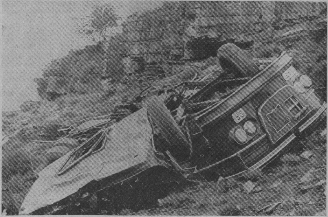
Zaragoza.—Un total de ocho muertos y 21 heridos es el balance provisional del accidente ocurrido ayer al precipitarse un autobús al río Isuela. El autobús iba ocupado por cazadores aragoneses que habían pasado todo el día en el campo y regresaban a la ciudad.

Se lo aconseja el Plan Nacional de Higiene y Seguridad del Trabajo.