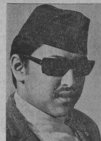
Birendra, nuevo Rey de Nepal al suceder a su padre, el Rey Mahendra, fallecido recientemente. El nuevo soberano nepalí cuenta 27 años de edad.