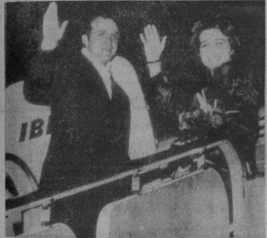
Don Juan Carlos y Doña Sofía, en el momento de partir del aeropuerto de Barajas con destino al Japón. Los Príncipes de España permanecerán seis días en visita oficial invitados por el Emperador Hiro-Hito. Les acompaña en su viaje el ministro de Asuntos Exteriores, señor López Bravo.

El ministro señor López Bravo, que llegó a las cuatro de la tarde de Mauritania y Marruecos no descendió del avión en Nueva York, per-