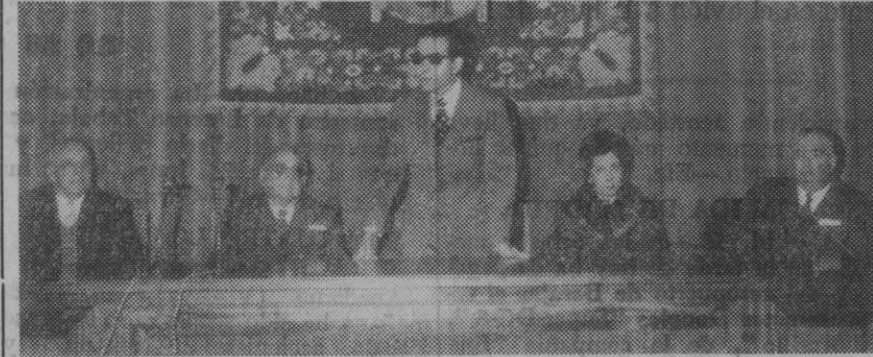
El curso de Educación y Ciencia en el momento de declarar inaugurado el curso de puericultura para profesoras de E. G. B.

Mañana, con motivo de la festividad de San Sebastián, en esta iglesia se oficiará, a las 7,45 de la tarde, una solemne asamblea eucarística.