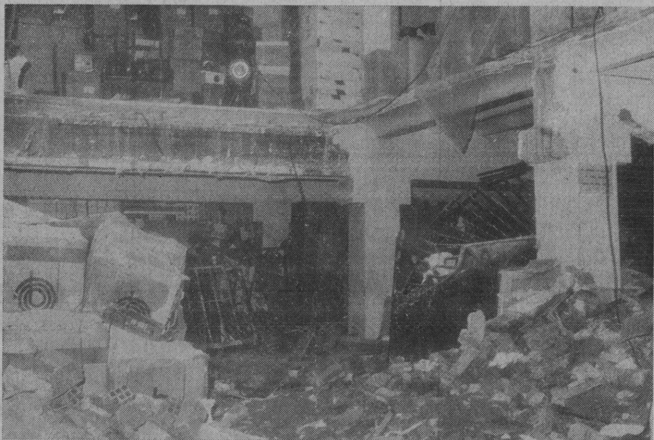
Barcelona.—Cuatro personas han resultado muertas y otras tres heridas al producirse un derrumbamiento en un edificio situado en la calle Travesía Martí, en el que se estaban efectuando obras de reforma.

Según ha manifestado a "Cifra" un portavoz del Palacio de la Zarzuela, a lo largo de la jornada se han recibido millares de mensajes de felicitación al Príncipe por su cumpleaños.