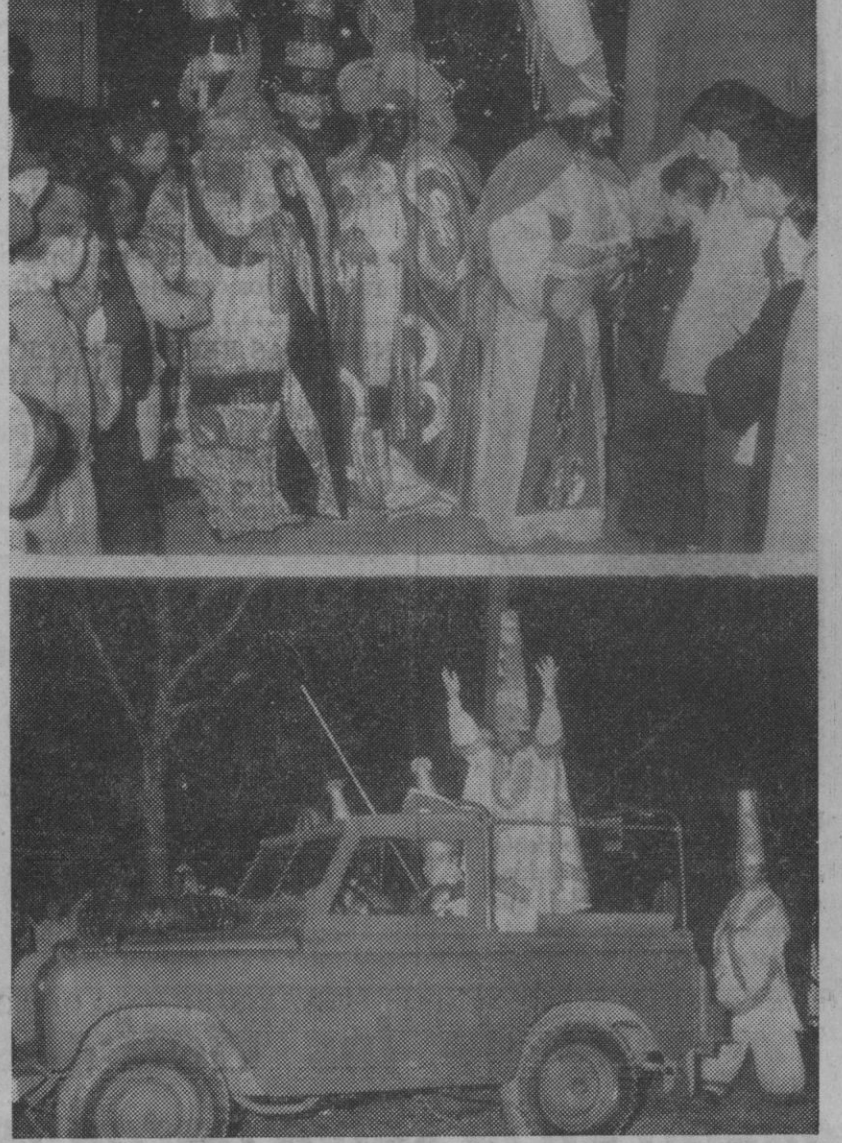
En el grabado superior, Melchor, Gaspar y Baltasar en el momento de hacer su entrada en el Ayuntamiento. En la inferior, el Príncipe Aliatar saludando desde su jeep.

EN LA RESIDENCIA Y SINDICATOS Poco después de concluido el itinerario seguido por la cabalgata, los Reyes Magos se trasladaron a la Residencia Provincial, en la que fueron objeto de una gran acogida por los niños de la misma, entre los que repartieron multitud de juguetes. Presenciaron el acto el gobernador, presidente de la Diputación y alcalde, junto al director de la Residencia y religiosas de la comunidad. Por último, los monarcas se trasladaron a la Delegación Sindical, como centro representativo del mundo del trabajo segoviano, para proceder también allí a un reparto de juguetes.