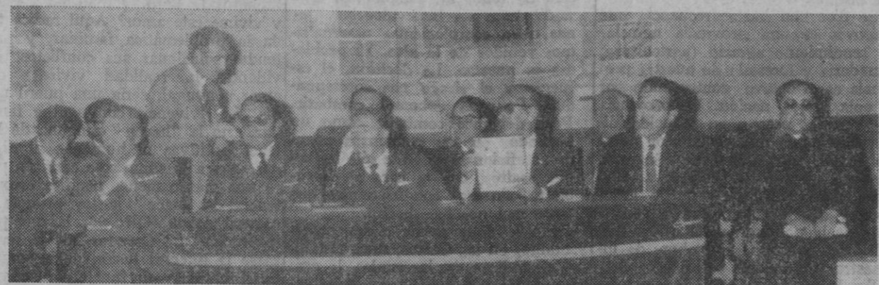
La presidencia en el acto de clausura del Congreso.