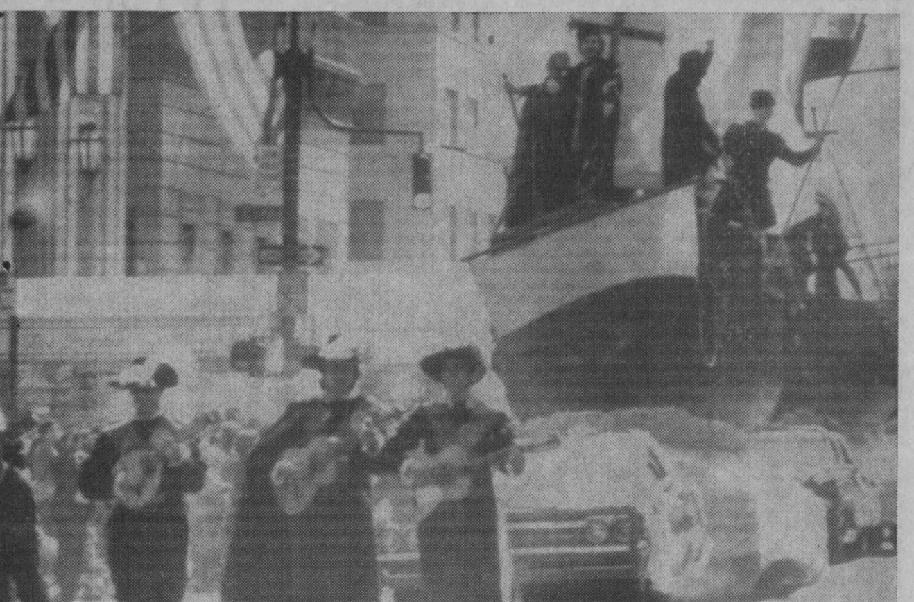
Nueva York.—Los trovadores precediendo la carroza con la réplica de las carabelas que Colón utilizó en su viaje a América. Parte del gran desfile que se celebra en Nueva York. El desfile trataba de sobrealzar a los 22 millones de americanos de habla hispanica y a los 250 millones de hispanohablantes en el mundo.

Londres, 18.—La Reina Isabel de Inglaterra salió hoy en avión del aeropuerto londinense de Heathrow para comenzar su visita oficial a Turquía.