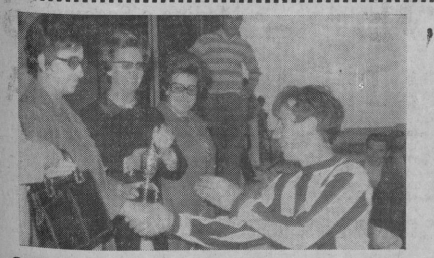
Con motivo de celebrar ayer la fiesta de su Patrona la Hermandad del Comercio, de las HH. del Trabajo, se organizó un encuentro amistoso de fútbol, en El Peñascal. El equipo de Zamarramala venció por 4-1 al Novesia de Hermandades. En el grabado, momento en que el capitán del equipo vencedor recibe el trofeo.