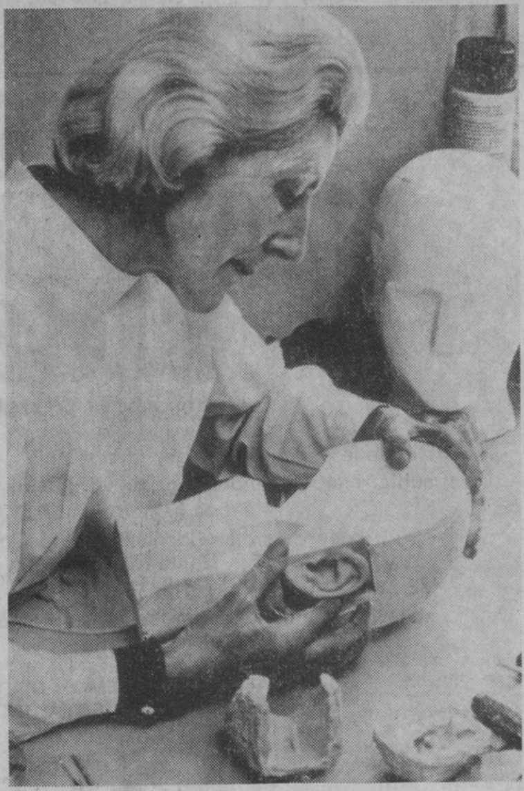
Berlín Occidental.—Esta cabeza confeccionada a piezas, «oye», según dicen. Claro que las orejas son de goma y llevan micrófonos. El oído copiado exactamente del oído humano registra el campo acústico de cualquier sala y retiene el sonido en una cinta magnetofónica. A la cabeza la han dado el nombre de «Félix». Lo que no sabemos es si, aparte de la reproducción de lo escuchado y grabado, cómo podría pronunciar por su propia cuenta.