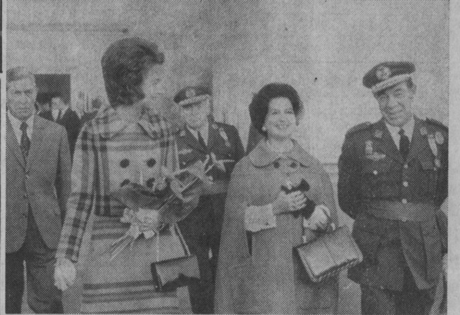
Madrid.—Los Príncipes de España, don Juan Carlos y doña Sofía, han salido esta mañana desde Barajas, con rumbo a Teherán, desde donde se trasladarán a la antigua Persépolis para asistir a los actos del 2.500 aniversario de la fundación del imperio persa. Arriba, el Príncipe de España con el ministro de Asuntos Exteriores, momentos antes de su partida. Abajo, la Princesa Sofía y el ministro del Aire, poco antes de la salida hacia Irán.