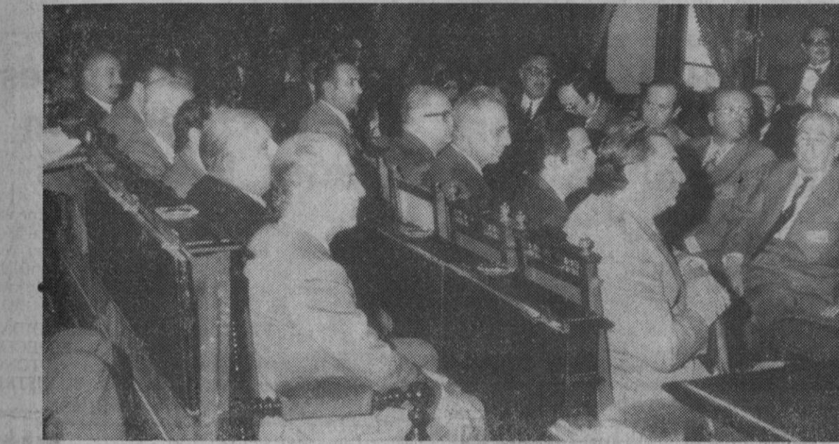
Esta mañana se ha inaugurado, según informamos en la sección de local, el V Congreso Nacional de Arquitectura Típica Regional. Las fotografías corresponden a dicho acto. En la primera, la presidencia, durante la conferencia del marqués de Lozoya; en la segunda aparecen un grupo de los numerosos congresistas asistentes.