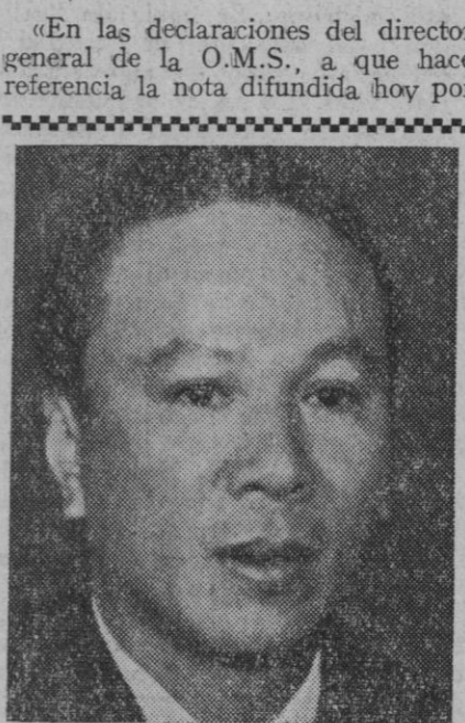
Nguyen Van Thieu, presidente de Vietnam del Sur, único candidato a las elecciones presidenciales que tendrán lugar el 3 de octubre

Madrid, 7.—La Dirección General de Prensa ha facilitado la siguiente nota en relación con el informe enviado por la Dirección General de Sanidad a la Organización Mundial de la Salud: