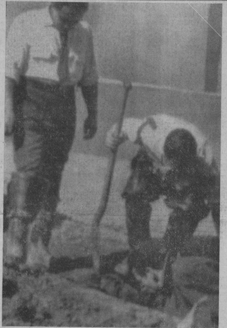
Montevideo.—Policías uruguayos cavan en busca del túnel por el que escaparon de la cárcel de Punta Carreras unos ciento veinticinco tupamaros. La fuga en masa es la segunda llevada a efecto por los tupamaros en dos meses.

El Cairo, 8.—El presidente Anwar El Sadat disolvió hoy el Parlamento egipcio—Consejo compuesto por 360 miembros—y ordenó nuevas elecciones para el próximo 27 de octubre. Esto forma parte de su amplio programa político de reforma. El presidente Sadat prometió reformar las instalaciones políticas egipcias tras el fallido golpe de Estado del pasado mes de mayo. La primera reunión del nuevo Consejo será el día 11 de noviembre.—Efe-Reuters.