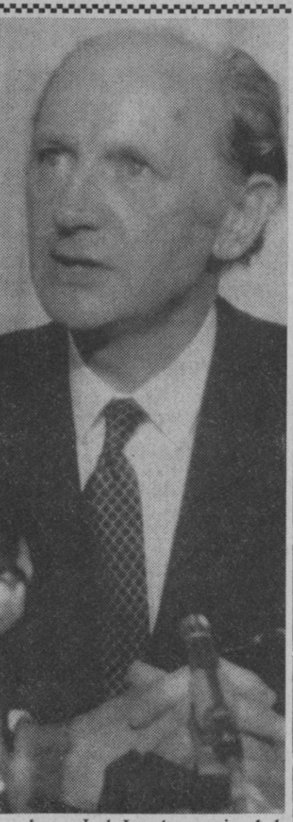
Londres.—Jack Lynch, premier de la República de Irlanda, en la rueda de prensa celebrada después de su entrevista con Edward Heath. No hubo ningún acuerdo para tratar de poner coto a la situación en Irlanda del Norte.

CONDUCTOR: Cuando vaya a efectuar un adelantamiento recuerde que una justa valoración de la distancia es de la mayor importancia