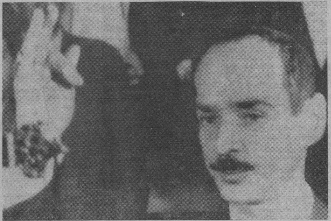
La Paz (Bolivia).—El coronel Hugo Banzer, nuevo Presidente de Bolivia, aparece durante su juramento en la Casa del Gobierno. Fue la iniciativa de Banzer y otros disidentes la que acabó con el régimen de Juan José Torres.

Para combatir a sus adversarios, ahora en el poder 12 muertos y 30 heridos en los combates de ayer en la Universidad de La Paz