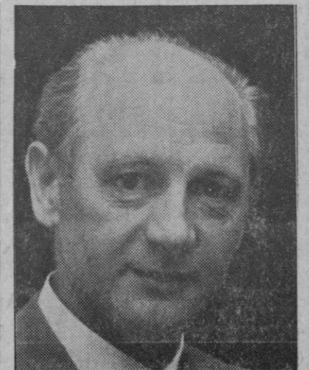
Jack Lynch, primer ministro de la República de Irlanda, que ha provocado profunda indignación en Belfast (Irlanda del Norte) por sus declaraciones pidiendo la dimisión del Gobierno a causa de la represión que ejerce sobre cuantos irlandeses del norte no pertenecen al Partido Unionista.

en la generalidad de los corros. Así tenemos a un grupo bancario totalmente en baja, con escasas significaciones; también los valores eléctricos declinan, aunque con una manifiesta irregularidad y diferencias positivas, con predominio de cesiones en el resto del parquet.