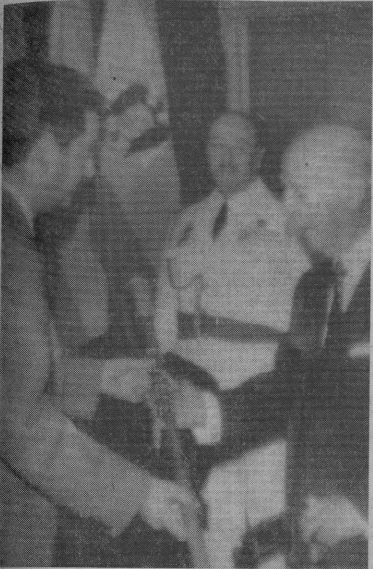
Puentedeume (La Coruña).—El Jefe del Estado recibe de manos del alcalde de Puentedeume el cetro de regidor perpetuo de la villa. (Telefoto Europa Press.)

DIRECCION, REDACCION, ADMINISTRACION Y TALLERES: SAN AGUSTIN, 7. — APARTADO DE CORREOS NUMERO 11. — TELEFONOS: DIRECCION, 17-50. REDACCION, 20-25. ADMINISTRACION E IMPRENTA, 22-99 Depósito Legal SG. 7-1958 Precio del ejemplar 5 pesetas