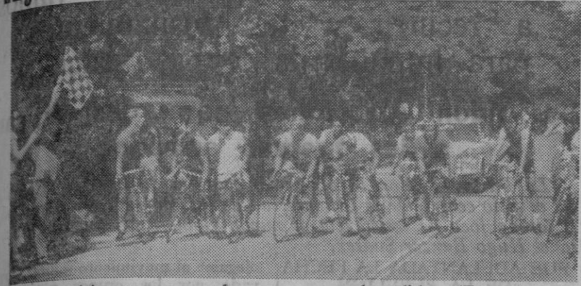
Varios participantes preparados para tomar la salida.

En La Granja y ante mucho público, se disputó el XI Gran Premio Ayuntamiento de San Ildefonso, prueba reservada a corredores aficionados de primera y segunda y de carácter nacional, clásica ya dentro del calendario de la Federación Española de Ciclismo.