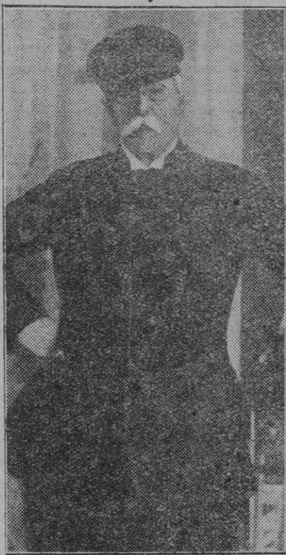
Tomás Massarik, Presidente de la república de Checo-Eslovaquia, que acaba de cumplir 80 años.