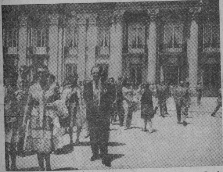
Hoy han visitado La Granja y Segovia los asistentes a la Conferencia Europea de Ministros de Transportes, según informamos en la sección de local. La fotografía fue obtenida durante su visita al palacio de La Granja, y en primer término aparece el ministro inglés de Transportes, Mr. Taylor.

Madrid, 18.—La junta rectora del servicio comercial de harinas de pescado ha acordado dirigirse al Gobierno, al objeto de exponer la difícil situación por la que atraviesan las empresas de este sector. Dichas dificultades concretadas en el cierre de algunas fábricas y la progresiva descapitalización de otras, tiene su origen según ha declarado a Cifra un portavoz del citado servicio, en las importaciones a precios más bajos que los nacionales, así como el hecho de que la producción nacional esté totalmente protegida de derechos arancelarios, impuestos de compensación de gravámenes interiores y derechos reguladores.—Cifra.