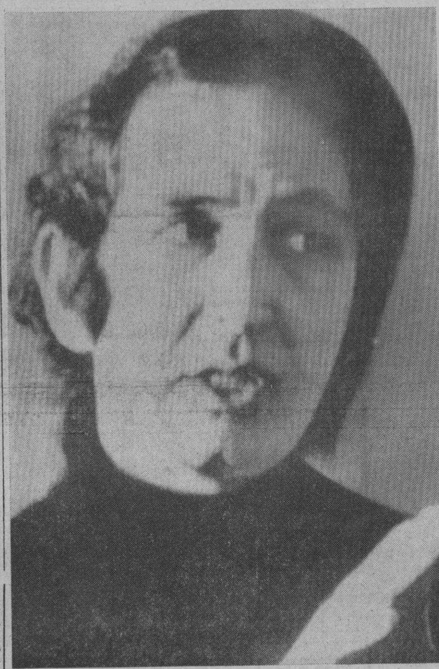
Daniel Ellsberg.—Un antiguo redactor del «New York Times» dijo la noche del miércoles que el informe secreto del Pentágono fue entregado al «Times» por Daniel Ellsberg, un antiguo empleado del departamento de Defensa y ahora ayudante de investigación en el Instituto de Tecnología de Massachusetts.

CONDUCTOR: Evite adelantar a un vehículo que esté a su vez adelantando a otro. En caso de duda, no efectúe la maniobra. importancia