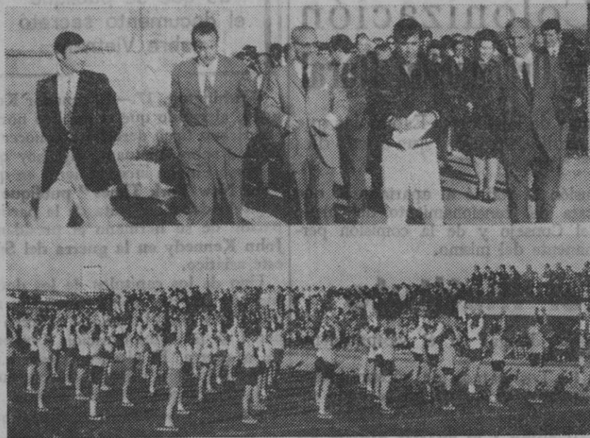
El gobernador civil, con otras personalidades, a su llegada al complejo deportivo de Santa María. Abajo, un momento de la demostración gimnástica.

Rodríguez, que destacó la importancia del acto por su misión de formación deportiva de los alumnos de Primera Enseñanza y de la Juventud rural y por la presencia de la primera autoridad provincial y demás autoridades. Explicó cómo la eficaz co-