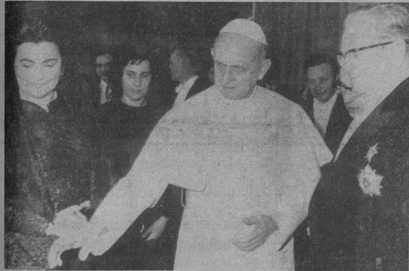
Ciudad del Vaticano.—Un momento de la audiencia del Santo Padre al presidente de Yugoslavia Tito, celebrada en el Vaticano.—(Telefoto AP-Europa Press.)

Añaden las primeras informaciones que numerosos refuerzos policiales han salido para el mencionado sector, señalando que se trata al parecer, de un refugio «tupamaro», descubierto por las patrullas de vigilancia. Se dice incluso que podría tratarse de la «Cárcel del Pueblo», donde los guerrilleros urbanos tienen al embajador británico Geoffrey Jackson.—Efe.