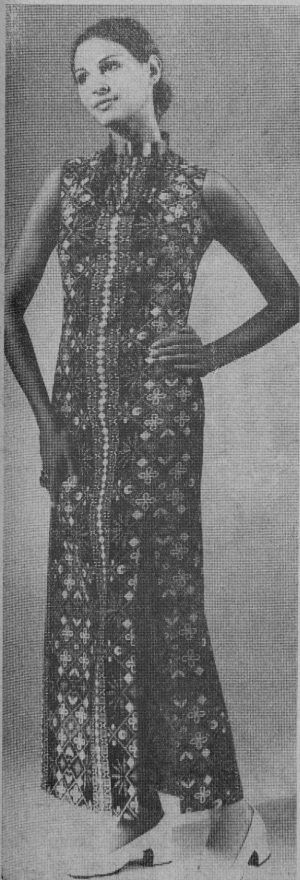
Aunque vuelva la minifalda, para cuantas no se decidan aún por ella aquí tienen este modelo de Palmés, estilo oriental

Los «mini-shorts» (llamados en Inglaterra «hot pant's») son favorecidos en la encuesta por una amplia mayoría de mujeres y hombres. No obstante, a la pregunta de dejaría usted que su esposa o novia se pusiese un «mini-short», un 59 por ciento de los hombres preguntados contestaron «no».