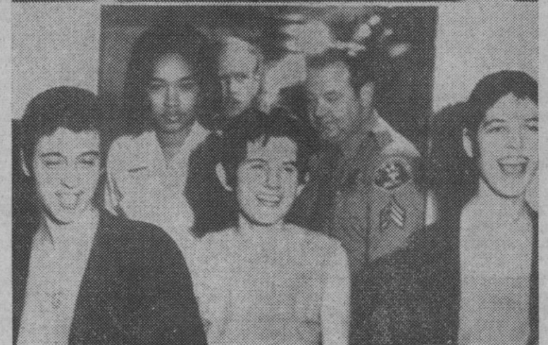
Los Angeles.—Manson y las tres mujeres de su clan, han sido condenados a muerte, a morir en la cámara de gas, por el asesinato de Sharon Tate y seis personas más.