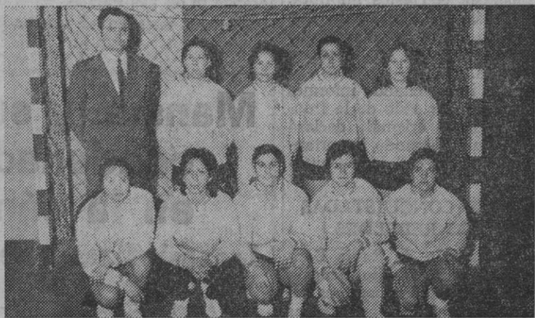
El equipo de balonmano del Imperio.—(Foto Lumen)

El Imperio tuvo una gran presentación en la Liga Nacional en su campo, aunque más le hubiese gustado un encuentro más disputado y bello para sus seguidores, con un Atlético Burgalés completo, y no desfigurado y menguado por falta de jugadoras.