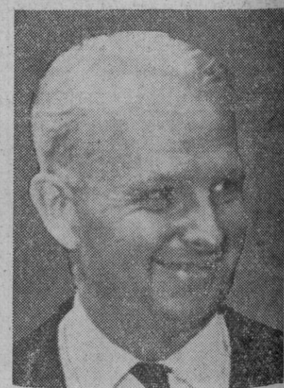
Brian Faulkner, que sucede a Chichester Clark como primer ministro de Irlanda del Norte

nos de la guerra de Vietnam, ha deliberado durante trece días, en el Consejo de guerra más largo de la historia norteamericana.