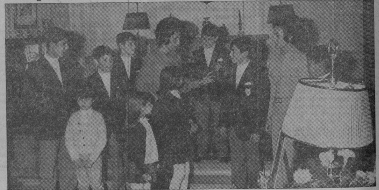
La esposa del gobernador civil departe con los seis niños, en su residencia, en presencia de sus hijas y de la esposa del delegado de la Juventud.