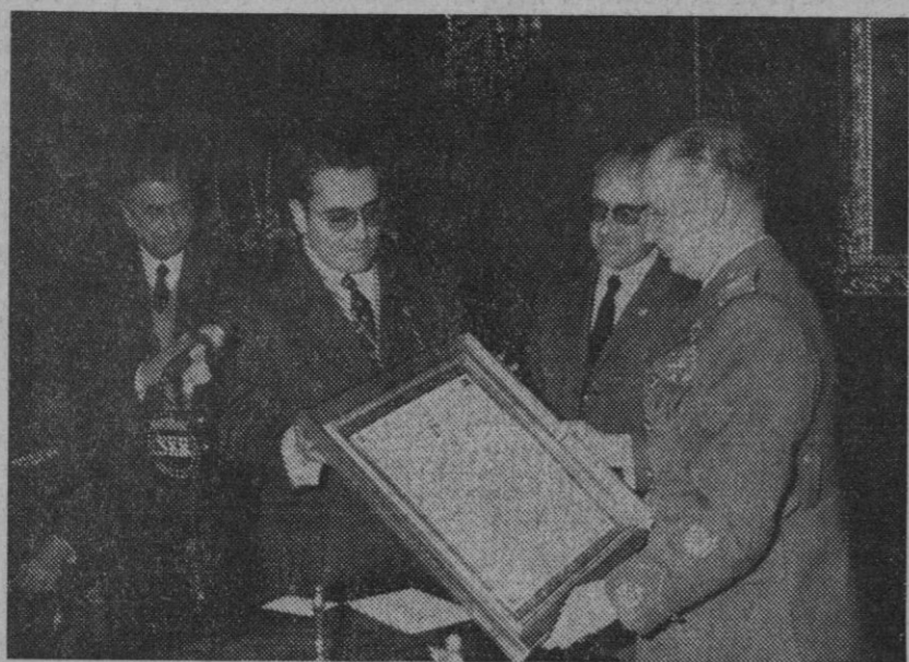
Según informamos en la sección de local, hoy se ha entregado el título de hijo adoptivo de Segovia al Capitán General de la VII Región Militar, con motivo de su próximo pase a la situación de reserva.

Temperaturas extremas de España: Máxima de 23 grados en Pontevedra y mínima de cinco grados bajo cero en Valladolid y Albacete.