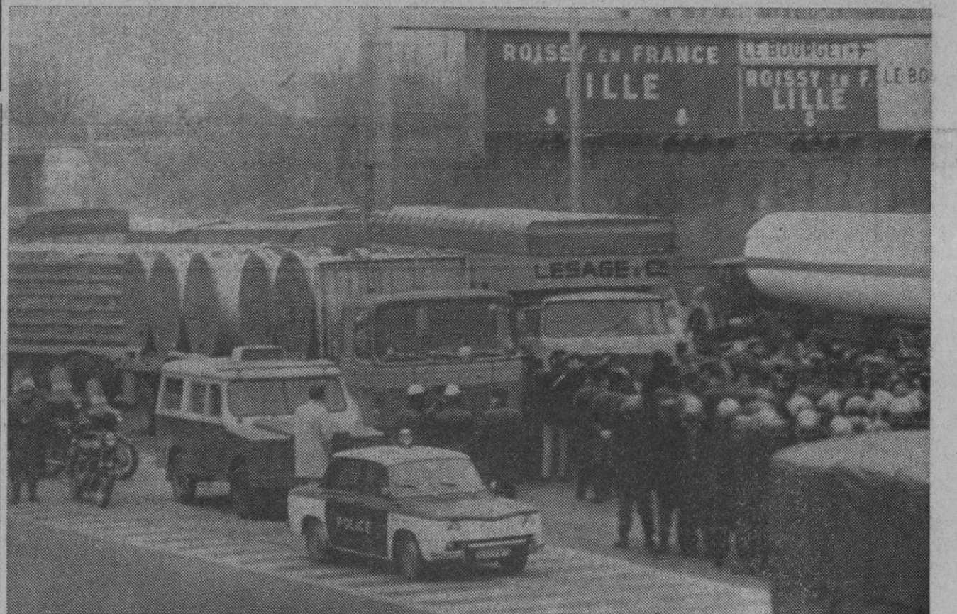
París.—Los camiones y efectivos de la policía en uno de los puntos de las autopistas de acceso a París, que quedaron bloqueadas por los pesados camiones protestando por la discriminación gubernamental hacia ellos.

En cualquier caso está ya fuera de duda que el nuevo yacimiento es de muchísima mayor trascendencia que la bolsa localizada en el campo de La Lora, en Burgos.—Cifra.