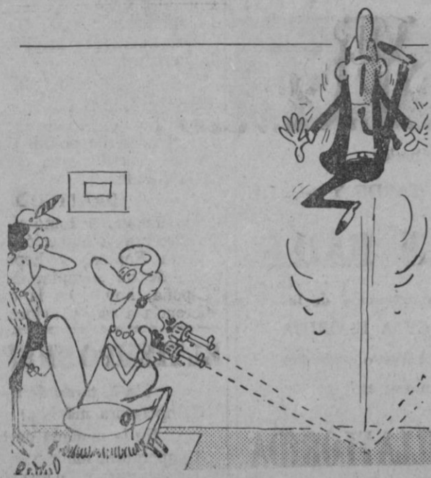
—Le estoy enseñando nuevos bailes...