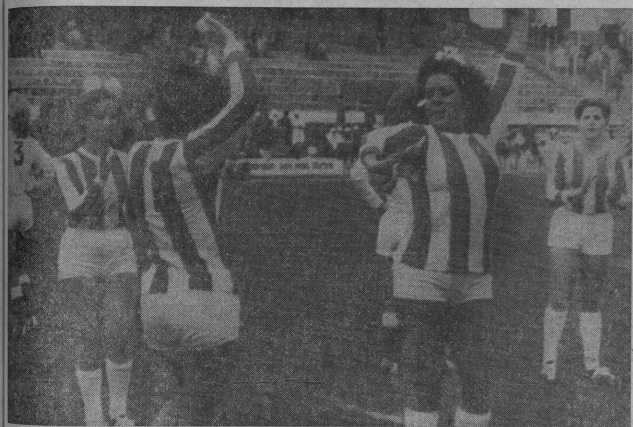
Sevilla.—De nuevo, esta vez en Sevilla, se han enfrentado "folkloricas" y "finolis". Vencieron las primeras por tres goles a cero. Hubo celebración por todo lo alto.

Montevideo, 20.—Un nuevo comunicado fue difundido anoche por el grupo de guerrilleros urbanos "tupamaros". En él señalan que un tribunal de la organización seguirá interrogando por tiempo aún no determinado al secuestrado fiscal de Gobierno, Guido Berro Oribe.