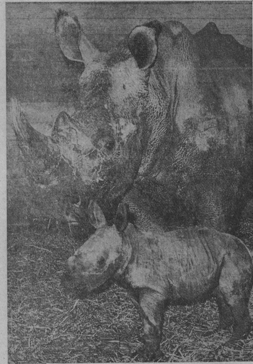
Hanóver.—Rinocerontes de boca ancha son los animales más grandes de África después de los elefantes. Se supone que ya no viven más que unos cientos de animales de este género. El cuarto ejemplar nacido en el cautiverio vino al mundo en Alemania y es este "pequeño" que aparece en la foto. Pesó cuarenta kilogramos en su primer día de vida, peso pluma en comparación con los más de mil kilos de su madre.—(DaD)

Valladolid, 19.—Una vaca que estaba en el matadero municipal rompió varias tablas de una empalizada y salió al patio aprovechando después un momento en el que estuvieron abiertas las puertas del matadero para escapar y emprender veloz carrera por el paseo de Zorrilla. Dos motoristas municipales la flanquearon para proteger a los transeúntes, y, escoltada por ellos, atravesó la ciudad, perdiéndose de vista en el campo.—Cifra.