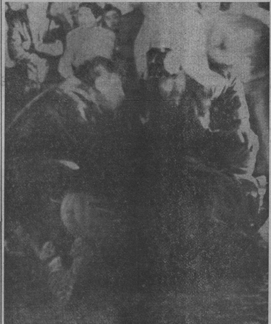
Valencia.—Un bombero practica la respiración boca a boca a uno de los heridos en la explosión de cohetes registrada anoche en las inmediaciones de la plaza del Caudillo, cuando iban a quemarse las "fallas".—(Telefoto Europa Press).