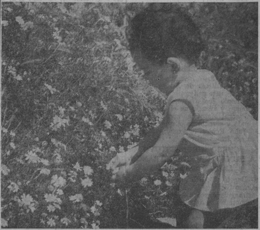
Mañana es primavera...

¿Es Dios, es el diablo / o los dos a la vez / que uniéndose un día han hecho esta primavera / ¿Es uno u otro? / En verdad no lo sé /