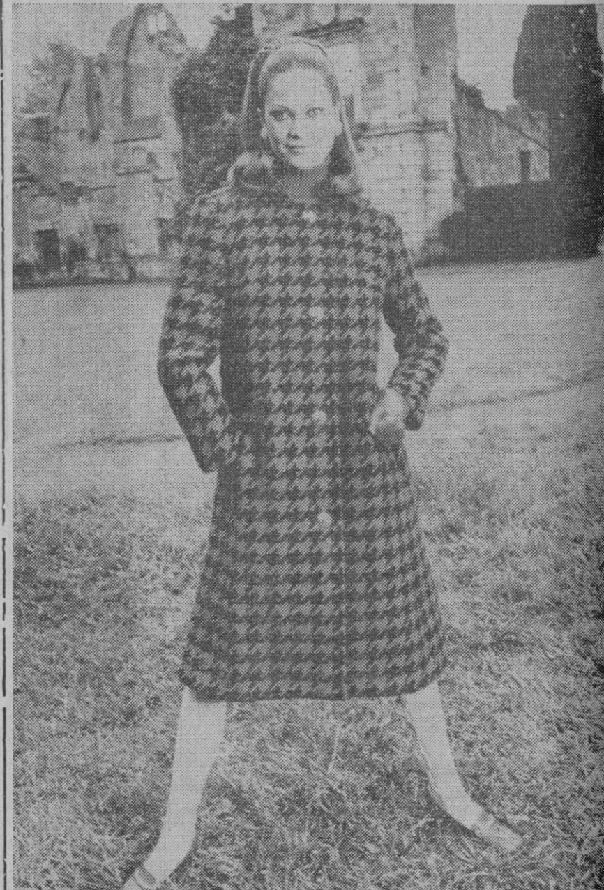
«Toscana», un abrigo clásico en mezcilla irlandesa a grandes cuadros de diente de perro, parte de la colección de otoño de 1970 presentado recientemente por Aquascutum. Elegante confeccionado dentro de la línea midi, tiene una forma suave en la cintura y grandes botones que detienen la pechera llana. Mangas intercaladas, profundos pliegues y medio cinturón a la espalda son otras características de esta fina prenda. En los modelos confeccionados por la compañía se pone de relieve las hombreras y cinturas ajustadas y faldas acampanadas con atención al dobladillo inferior. Al mismo tiempo se puso cuidado en la selección de materiales para la colección y se incluyeron las mejores mezcillas, cachemiras, pelo de camello y algodones impermeables.

Entre las aspiraciones, el comunicado enumera: la libertad sindical, la representatividad, la autonomía y la participación.