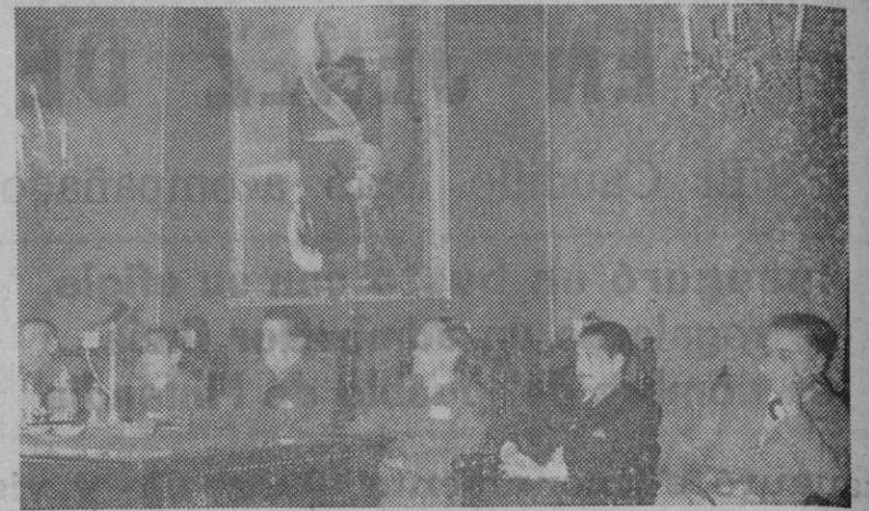
La presidencia del acto.