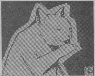
Para que el gato se tome su medicina

Si su gato se niega a tomar la medicina que le ha mandado el veterinario, derrámela en sus patas, en donde pueda lamersela. Pronto la limpiará con su lengua y mejorará.