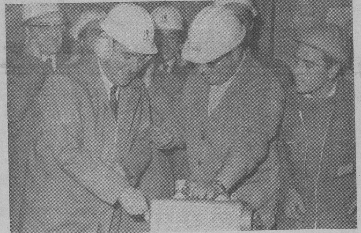
Madrid.—El ministro de Obras Públicas acciona el dispositivo que causa la explosión que perfora el último tramo del segundo túnel del Guadarrama en la autopista Villalba-Villacastín.