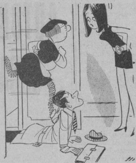
—No te pongas en medio, ¿no ves que ella tiene prisa...?

Distribuidor exclusivo: CASA SOLERA Corpus, 7