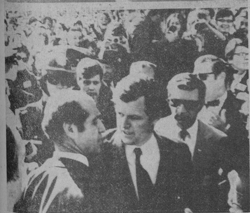
El presidente Nixon ha iniciado su campaña por distintos Estados para apoyar la candidatura de los republicanos a gobernadores y miembros del Senado. Edward Kennedy hace lo propio en apoyo de los demócratas. Arriba: Nixon (que fue apedreado por un grupo de manifestantes anti-guerra). Abajo: Kennedy en su campaña en Albany.