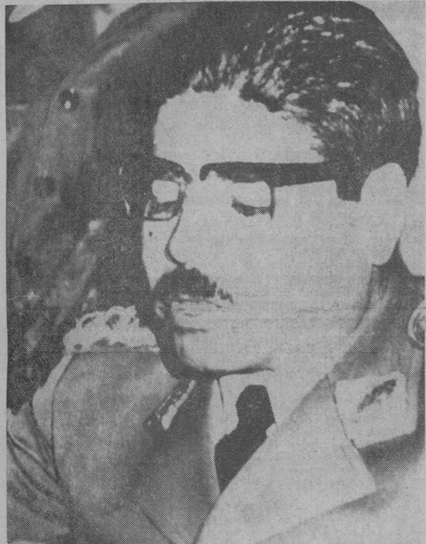
La Paz (Bolivia).—El general boliviano Juan José Torres González, jefe izquierdista de un importante grupo de las fuerzas armadas de Bolivia, en el momento de leer su proclama revolucionaria en La Paz, por la cual se autoproclama "presidente revolucionario" del país, que atraviesa una situación confusa.

La Paz, 7.—Las tropas que apoyan al general Juan José Torres, de tendencia izquierdista, han reconquistado el palacio presidencial de La Paz, después de que los tres miembros de la Junta Militar, de tendencia derechista, presentaran su renuncia hoy. Las fuerzas que apoyaban a los tres militares derechistas han abandonado su guarnición en la capital.