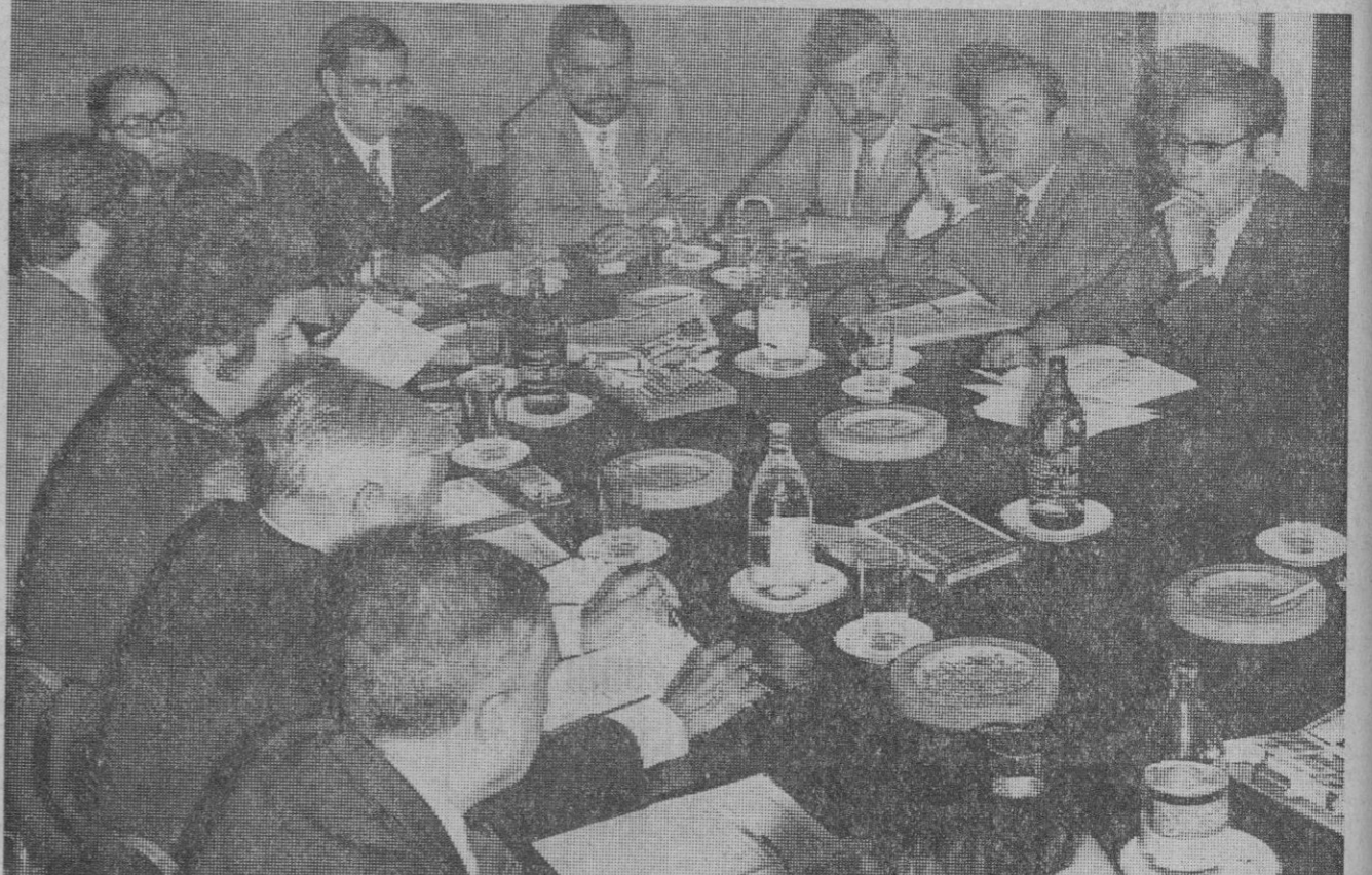
Madrid.—Los representantes de las trece agencias gráficas de prensa más importantes de Europa se reunieron en Madrid para el desarrollo de la Asamblea general correspondiente al año mil novecientos setenta. Europa Press representa a España en esta organización internacional. En la foto: los asambleístas durante una de las sesiones de trabajo.

Su estado de salud se recupera con toda normalidad, aunque los médicos no le permiten todavía visitas, salvo las de su esposa e hijos.—Cifra.