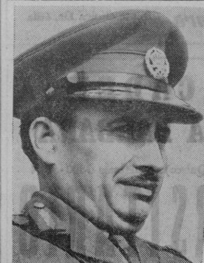
El mariscal Habes El Majali, gobernador general de Jordania que ha dirigido las operaciones contra los guerrilleros palestinos en estos días pasados de lucha

Derecho y Filosofía y Letras son las Facultades a las que aspira un mayor número de solicitantes, pero también hay una buena cifra de practicantes que quieren seguir Medicina en la nueva Facultad ovetense.