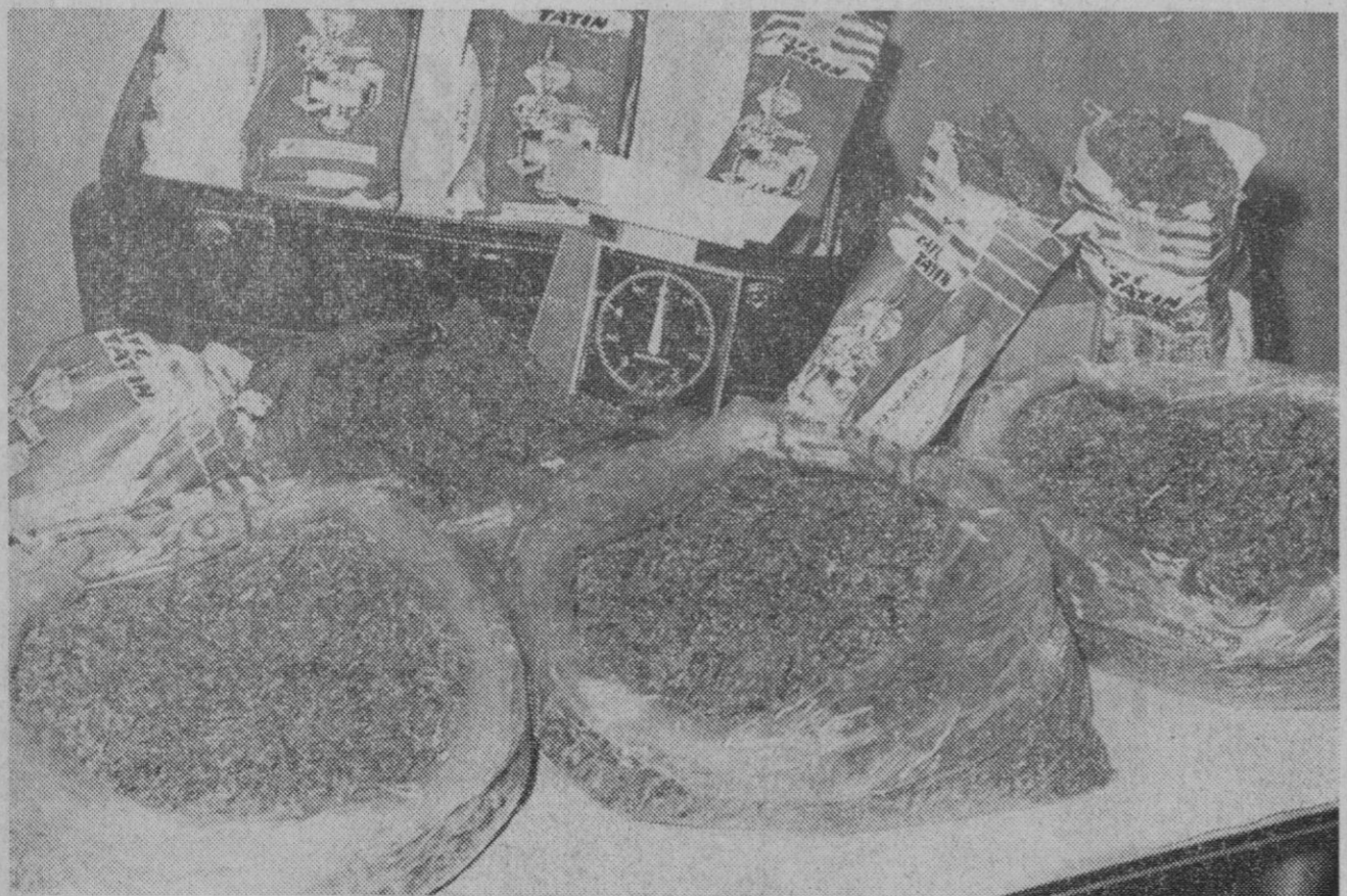
Málaga.—Esta es una parte importante de los diez kilos de grilla descubiertos por la policía de Málaga en una maleta, la cual iba a ser transportada al norte de España para su distribución.

Nixon y el dirigente yugoslavo abandonaron Belgrado en aviones separados, después de celebrar conversaciones sobre la situación internacional. Los dos estadistas visitarán la ciudad industrial de Zagreb, antes de partir hacia el lugar donde nació el presidente Tito, la pequeña localidad de Kumrovec.—Efe-Reuter.