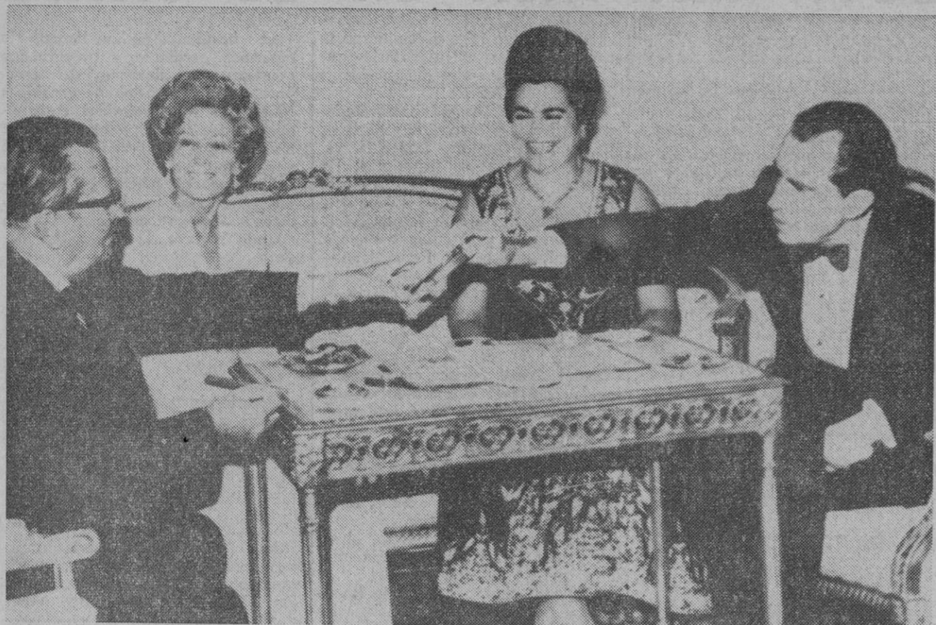
Belgrado.—El presidente yugoslavo Tito (izquierda), ofrece un cigarro al presidente Nixon, tras la cena con que le obsequió en el White Palace. Observándoseles sonrientes, se encuentran en el centro la señora Nixon (izquierda) y la señora Broz.