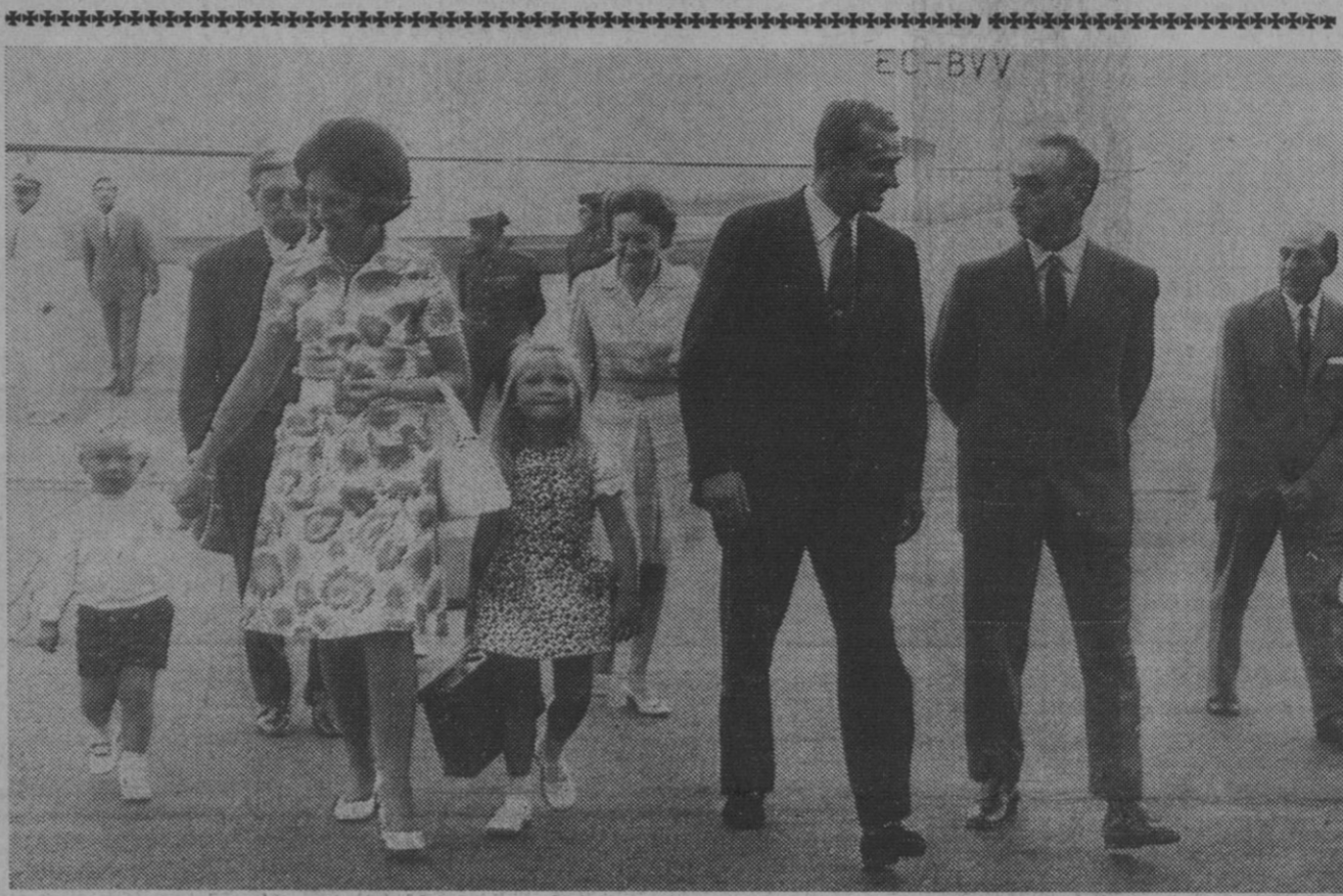
Madrid.—Los Príncipes de España, Juan Carlos y Sofía, acompañados de sus hijos, han regresado, procedentes de Roma, en avión especial del Ejército del Aire.