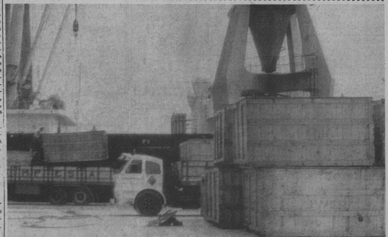
Santurce.—Momento de la descarga en el puerto de alguno de los telares "exportados" por Matesa a Estados Unidos, Inglaterra y Perú. Son ochocientos treinta y seis telares "Jover" de los cuatro mil que tenía "exportados" dicha empresa.

Esta Comisión ministerial tiene el encargo de presentar al Gobierno un informe para elaboración de un proyecto de ley sobre dicho régimen, en virtud de una disposición transitoria de la ley de reforma del sistema tributario.—Cifra.