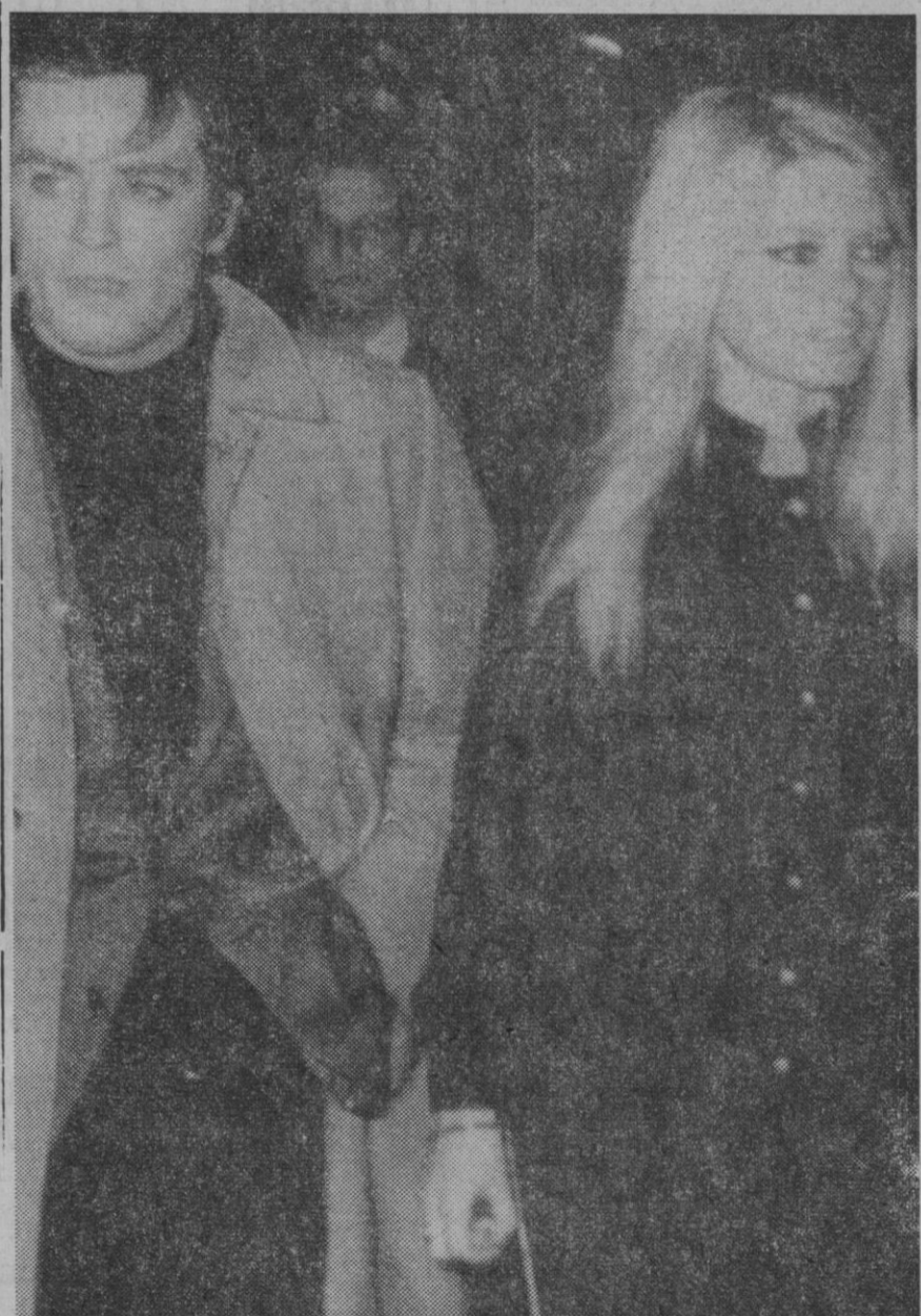
Los grandes del cine francés: Brigitte Bardot y Alain Delon. Alain se quejaba de que nunca le colocan junto a Brigitte. Ahora, suponemos, ya estará contento. Ahí está junto al "monumento" francés.

El doctor Echen- dia, a quien en este viaje acompaña su esposa, doña Emilia de Echen- dia, es actualmente embajador de su país en la Santa Sede, y al terminar su estancia en Madrid emprenderá viaje de regreso a Roma.—Cifra.