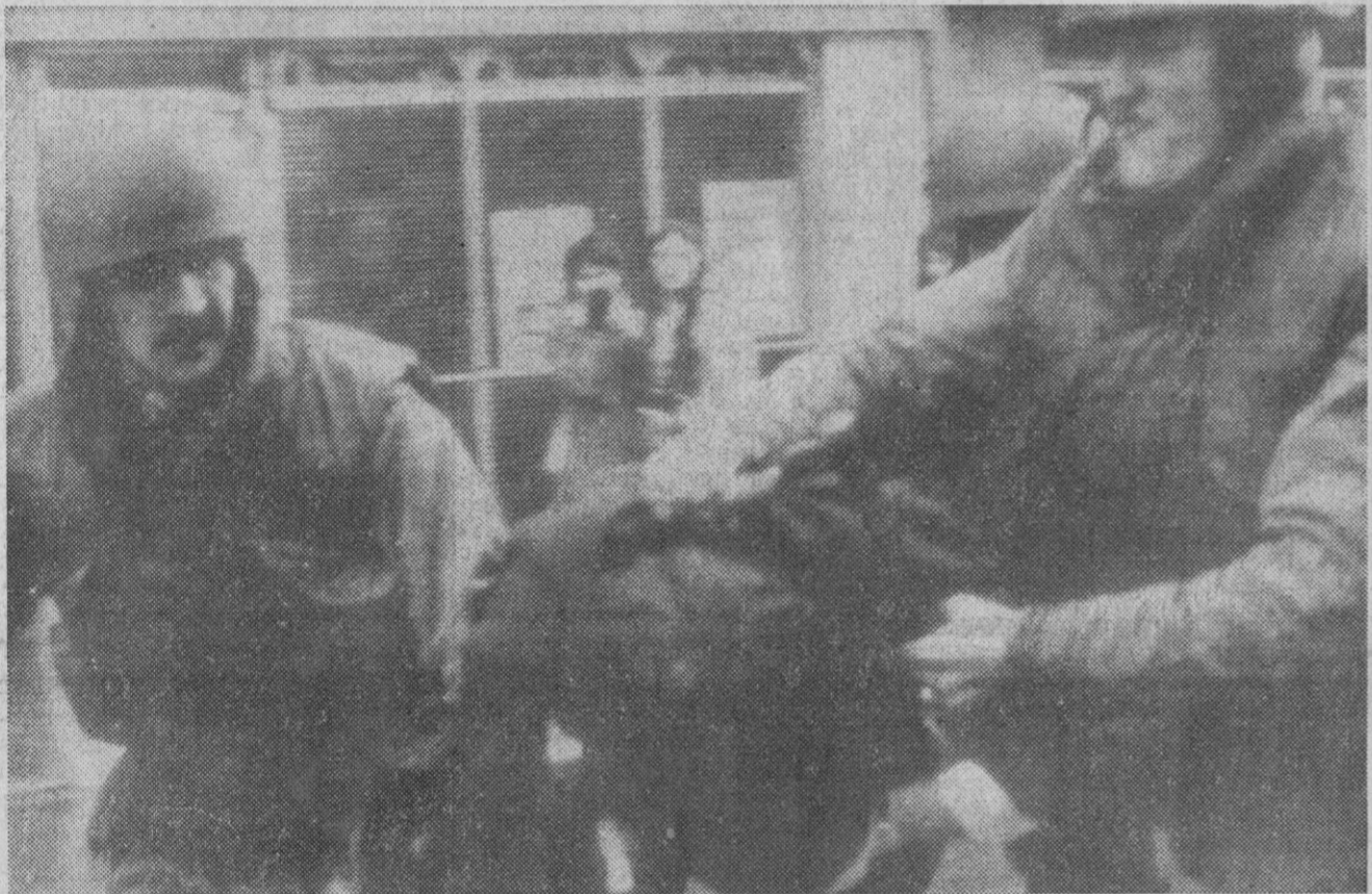
Belfast.—Tropas británicas detienen a un manifestante en la zona de Londonderry, durante los desfiles procesionales del domingo de Resurrección, cuando un grupo de jóvenes trató de asaltar los puestos de la Policía.

El texto del mensaje del Santo Padre es el siguiente: «Al tener conocimiento con viva pena de la noticia del terremoto que ha causado ruinas y luto en tantas familias de vuestro querido país os aseguramos que, de todo corazón, tomamos parte en esta prueba que afecta a la nación. Invocando la divina misericordia sobre las víctimas de la dolorosa catástrofe, expresamos a vuestra excelencia y a toda la nación turca nuestra más sincera condolencia. Paulus P. P. VI».—Efe.