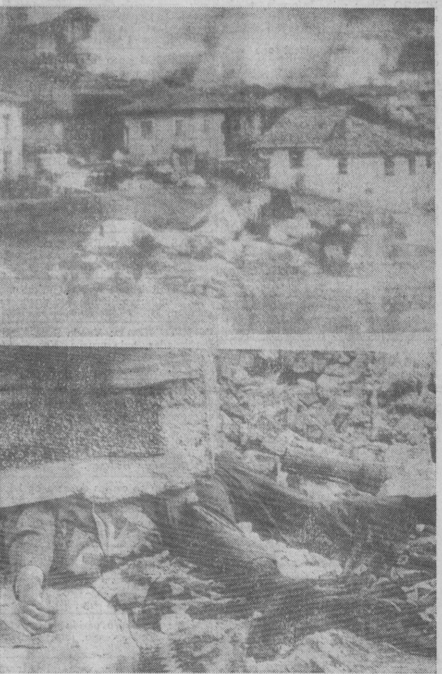
Gediz (Turquía).—Dos impresionantes documentos gráficos de la asolada ciudad turca de Gediz, azotada por un fuerte temblor de tierra que ha causado más de quinientos muertos y ha dejado sin hogar a miles de personas.

Phnom Penh, 30.—Tropas del Vietcong están penetrando en el reino de Camboya a lo largo de la frontera con Vietnam (unos 800 kilómetros), según informa hoy el Ministerio camboyano de Defensa.