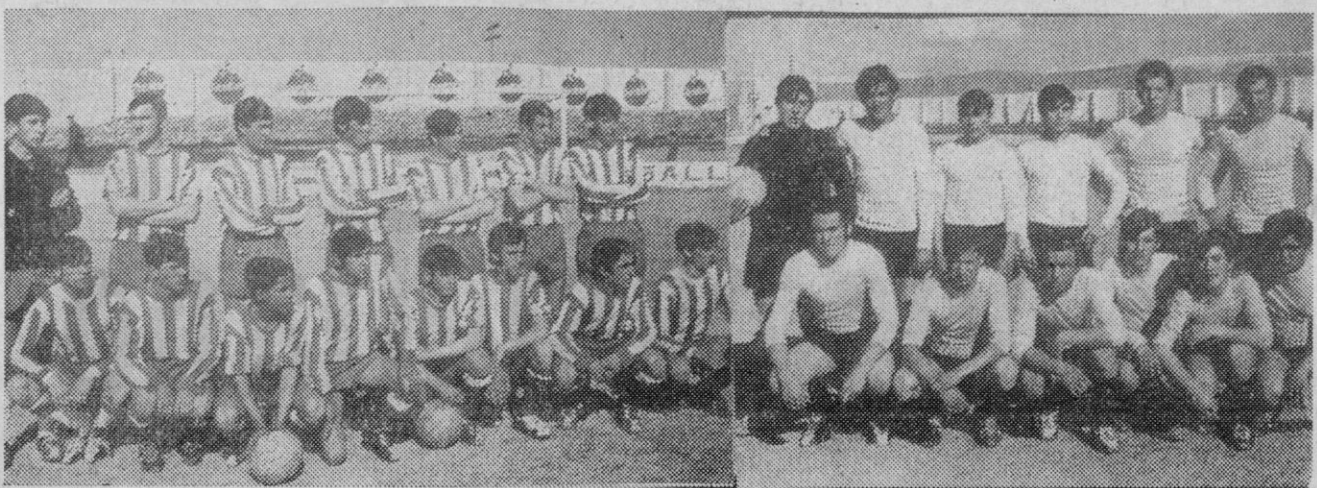
Los equipos juvenil del Acueducto, y C. D. San Rafael.

Otras preparaciones por correspondencia: Preu, Filosofía y Letras, Generales al Magisterio, Gestores Administrativos, Habilitados de Clases Pasivas y Oposiciones al Cuerpo General Administrativo del Estado.