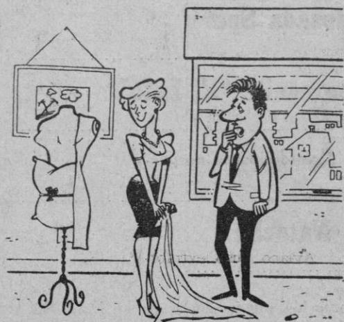
—¿Una buena noticia? ¿De qué se trata?