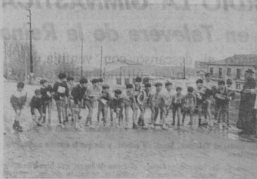
Los chavales, preparados para tomar la salida en una de las pruebas de atletismo.

Se celebró ayer, por los alrededores de Chamberí, el II Trofeo de Cross organizado por el Club Polideportivo Imperio O. J. E., de nuestra capital, en el que participaron cerca de cien corredores.