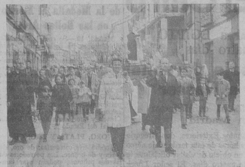
El cortejo procesional con la imagen de San Antonio Abad.

Después de la procesión vespertina, se efectuó la bendición de ganados