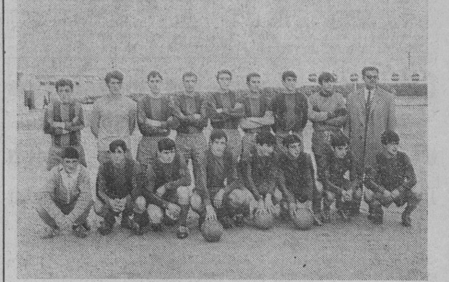
El equipo juvenil de la Gimnástica Segoviana que ayer jugó en El Peñascal.

Reparto de goles, dominio y puntos entre la Segoviana y el C. Caminos