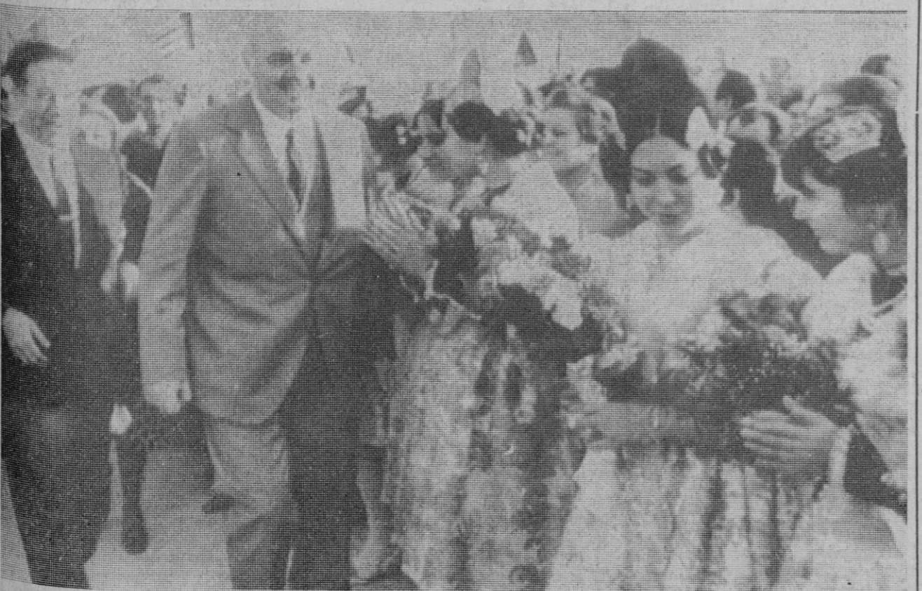
Paterna (Valencia).—El ministro de la Vivienda, don Vicente Montes, es recibido en su pueblo natal, donde posteriormente inauguró el grupo escolar que llevará su nombre. Aparece en la foto acompañado por el ministro de Educación y Ciencia, señor Villar Palasi.

Madrid, 19.—En la mañana de hoy visitó al ministro de Educación y Ciencia, don José Villar Palasi, el príncipe don Alfonso de Borbón Dampierre, embajador de España en Suecia.—Cifra.