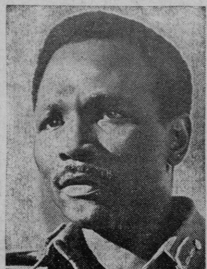
El general Yakubu Gowon, jefe del Estado de Nigeria, vencedor de la reciente guerra secesionista

Se cree, por tanto, que el Gabón preferiría una paz honorable en Nigeria que salvaguardase a la población de los ibos.—Efe-Reuters.