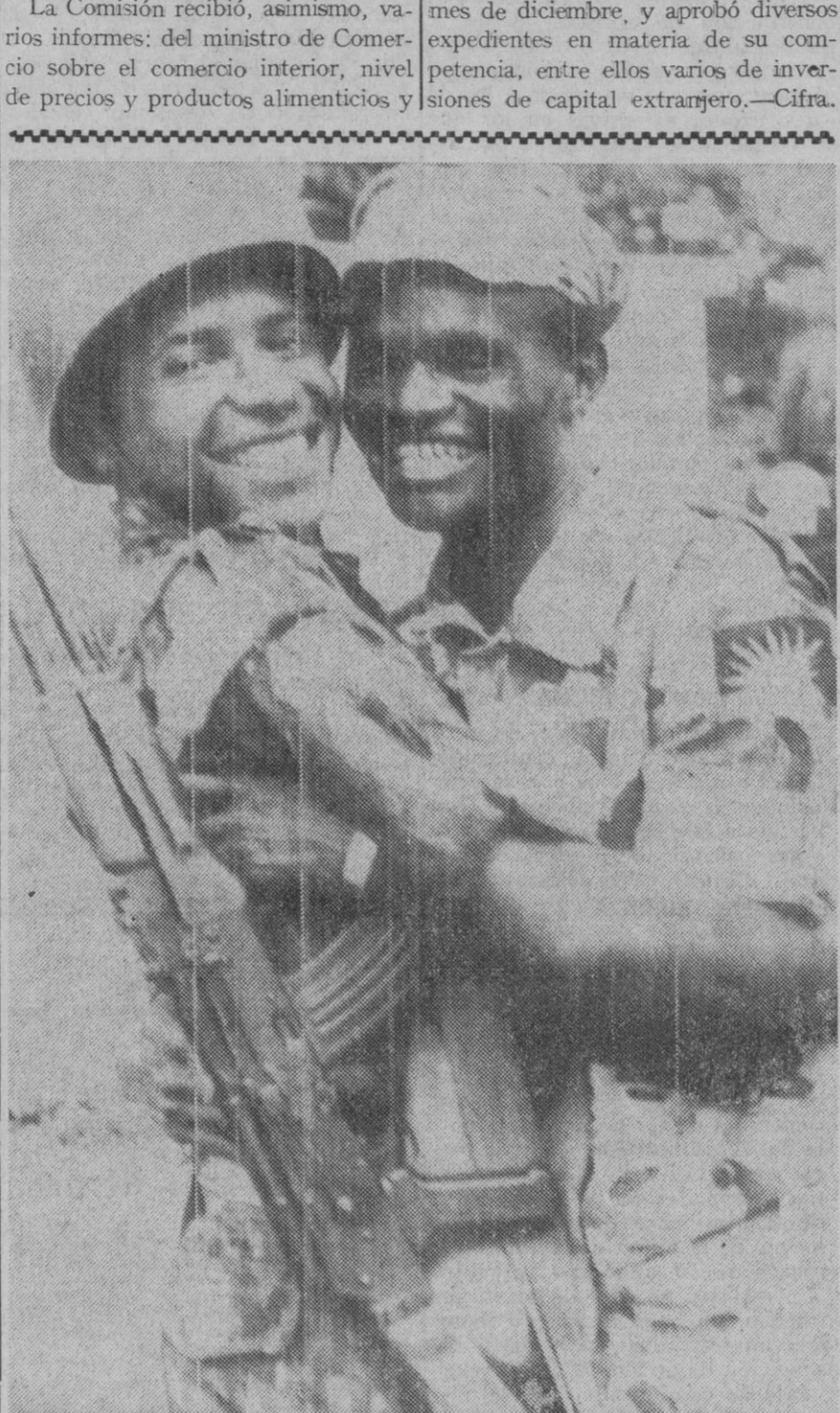
Lagos.—Un soldado federal abraza a uno de los soldados rebeldes momentos después de firmarse la rendición en la ciudad de Uli

sobre movimiento de importaciones y exportaciones; del ministro de Industria sobre su visita oficial a París; del ministro comisario del Plan de Desarrollo sobre estadística de salarios e índice del coste de la vida durante el mes de diciembre, y aprobó diversos expedientes en materia de su competencia, entre ellos varios de inversiones de capital extranjero.—Cifra.