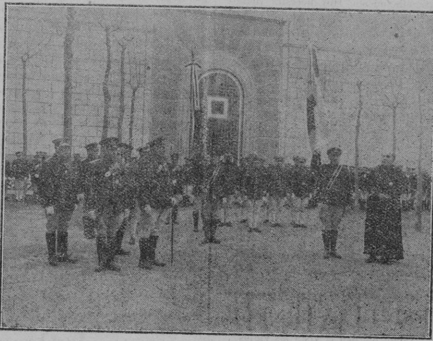
Barcelona.—Los nuevos camilleros de la Cruz Roja en el acto de la Promesa.

No sé, dijo, si en el interregno de tiempo, de transformación de Internacional en Nacional, de la Exposición, y con objeto de su reorganización, permanecerá ésta cerrada, durante diez o doce días, para que los obreros puedan trabajar y los camiones maniobrar libremente. De esto, agregó, yo no sé nada.