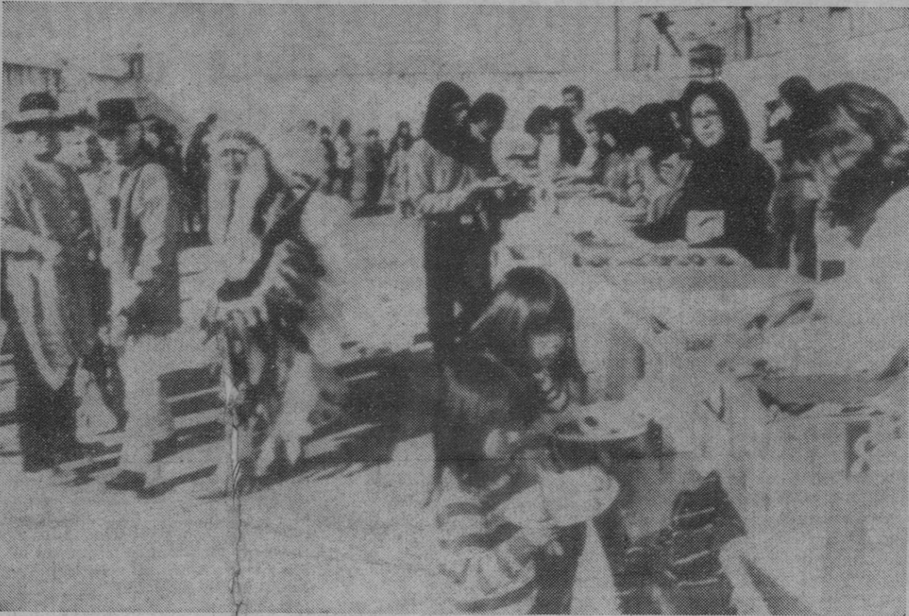
San Francisco.—Los indios sioux que se han encerrado en la prisión de Alcatraz y que reclaman la posesión de la isla, celebran con sus costumbres el Día de Acción de Gracias en uno de los patios de la fortaleza. Las viandas que aparecen en estado de repartirse fueron enviadas a la isla por un grupo de tenderos simpatizantes de los "pieles rojas", para que éstos celebraran en su retiro el Día de Acción de Gracias.

Según los círculos parlamentarios de Bonn, la Conferencia de La Haya será decisiva para la integración europea y la aplicación de la Comunidad Económica Europea o Mercado Común.—Efe.