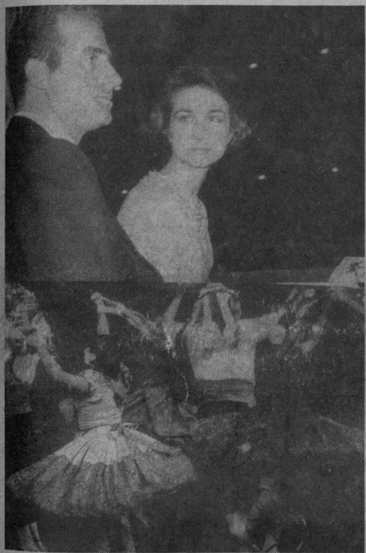
Madrid.—Los Príncipes de España, don Juan Carlos y doña Sofía, asistieron en el Teatro Español de Madrid al XVIII Concurso Nacional de Coros y Danzas de la Sección Femenina. Abajo, un momento de la actuación de uno de los grupos corales.

Estos diez aspirantes serán convocados individualmente para que, el próximo domingo, día 7, acudan a las instalaciones de la «Feria de Muestras». Las pruebas comenzarán a las once de la mañana, pero los «expertos» deberán presentarse una hora antes, con el objeto de que el inventor les explique detalladamente en qué consiste el mecanismo.