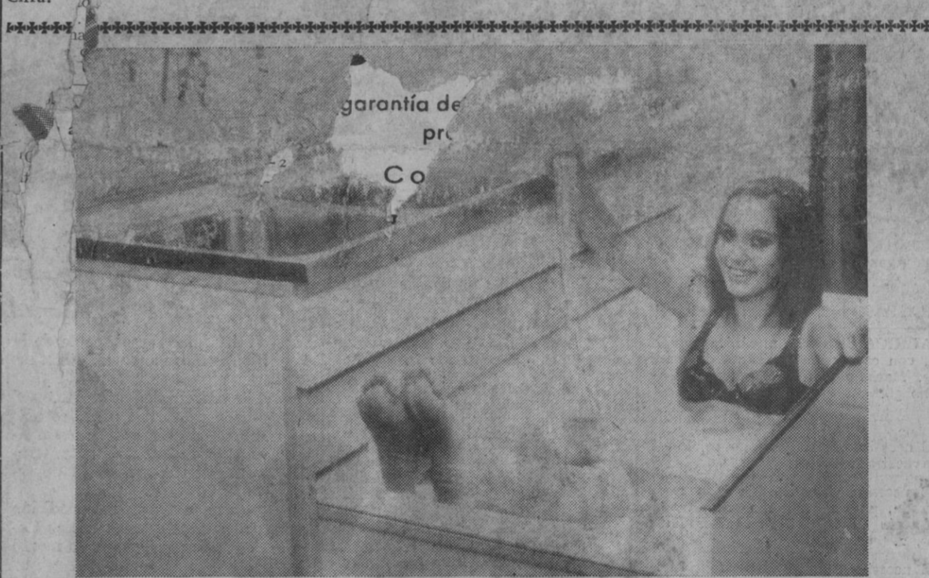
Francfort del Meno.—Después de utilizada, la bañera volverá a desaparecer en el armario fregadero el que estando cerrado, ocupa nada más que un escaso metro cuadrado de espacio útil. Este pequeño mueble con fregadero, bañera, ducha, calentador de circulación automática para agua hirviendo y grifo de empalme para la lavadora, constituyó la sensación de la exposición de enseres de casa, recientemente realizada en Wiesbaden (R. F. A.).

Cerró el acto el señor Garicano Goñi, quien mostró su reconocimiento por la colaboración que le habían prestado las autoridades de la provincia durante el desempeño de su cargo de gobernador civil de Barcelona.