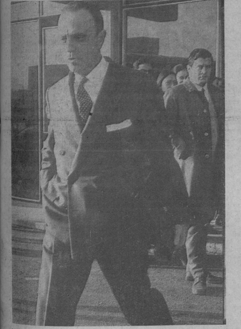
Madrid.—Se ha incorporado a su cátedra de Derecho Político de la Facultad de Ciencias Políticas de la Universidad de Madrid el ex-ministro de Información y Turismo, don Manuel Fraga Iribarne, a quien vemos llegando al aula para impartir la primera lección del curso.

Eibar (Guipúzcoa), 21.—Exploraciones y sondeos previos para posible localización de petróleo, se vienen efectuando en terrenos de Izkua, Arrasola, Illordo y Elgueta, en este término. Un equipo de operarios, con el material preciso, viene realizando desde hace unos días los trabajos pertinentes de reconocimiento previo del terreno a fin de la localización posible de alguna bolsa de petróleo. De momento, no se ha facilitado ningún detalle más sobre estos trabajos.—Cifra.