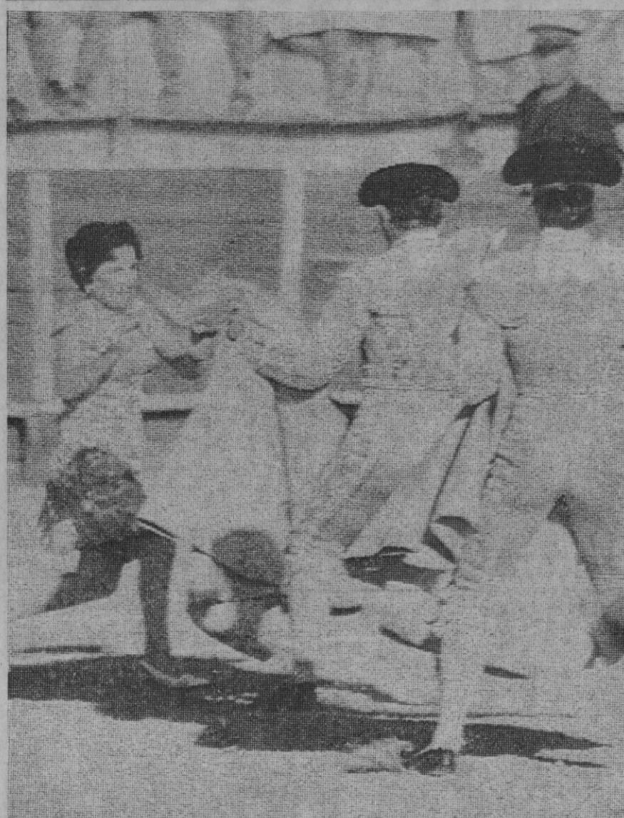
Córdoba.—La espontánea armó su revuelo consiguiente cuando se lanzó al ruedo en el primer toro de El Cordobés. Después de haberla detenido, resultó que había saltado para que El Cordobés la firmara un banderín. Peligrosa manera de obtener autógrafos.

Toda la prensa y medios informativos de Santiago y Valparaíso destacan hoy, en primera página, la personalidad política y humana del ministro español, a quien el prestigioso diario «La Estrella» califica de «padre del turismo español». Los demás diarios ponen asimismo de relieve el auge experimentado por el turismo en España desde que el señor Fraga se hizo cargo de la cartera de Información en 1962. El diario «La Tarde» titula a toda plana «España 69 recibe veinte millones de turistas». Por su parte, el diario «La Tercera» anuncia su llegada con la fotografía del ministro inserta a dos columnas.