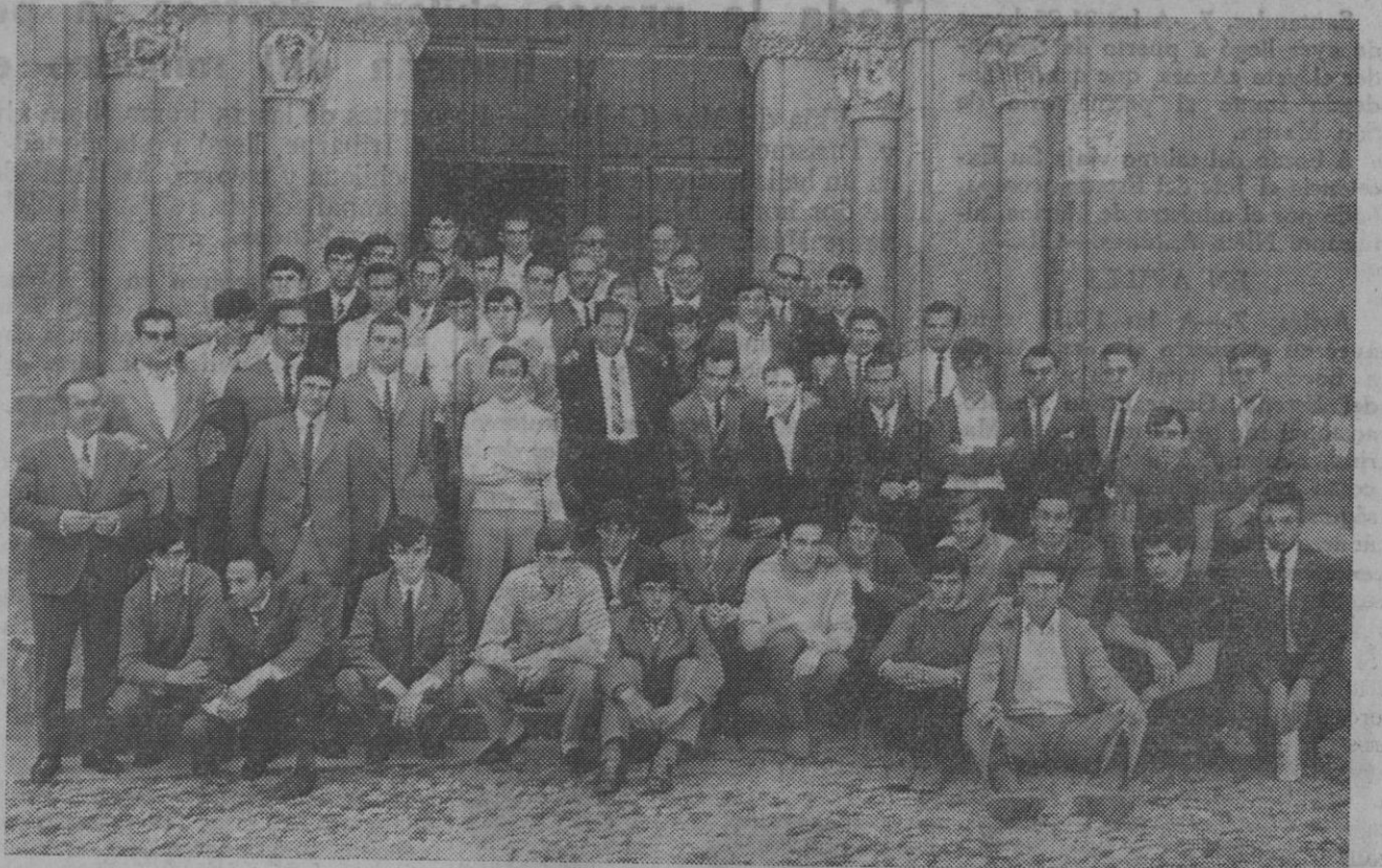
La Gimnástica Segoviana inició su temporada oficial con una misa que se celebró ayer, a las once, en la iglesia de la Santísima Trinidad. Asistieron directivos, técnicos, jugadores y varios aficionados, que aparecen fotografiados al salir de la ceremonia religiosa.

La Segoviana se anota los dos primeros negativos, que si bien ya supone un handicap para su marcha, tampoco quiere decir que esto sea irremediable, pues ya se sabe que es el primer partido de la temporada y que es necesario dar un margen de confianza al equipo, pues indudablemente creemos que hay base para poder un papel honroso en la competición; esperemos con confianza al próximo desplazamiento, donde siempre existe la posibilidad de anular los dos negativos.—H. G.