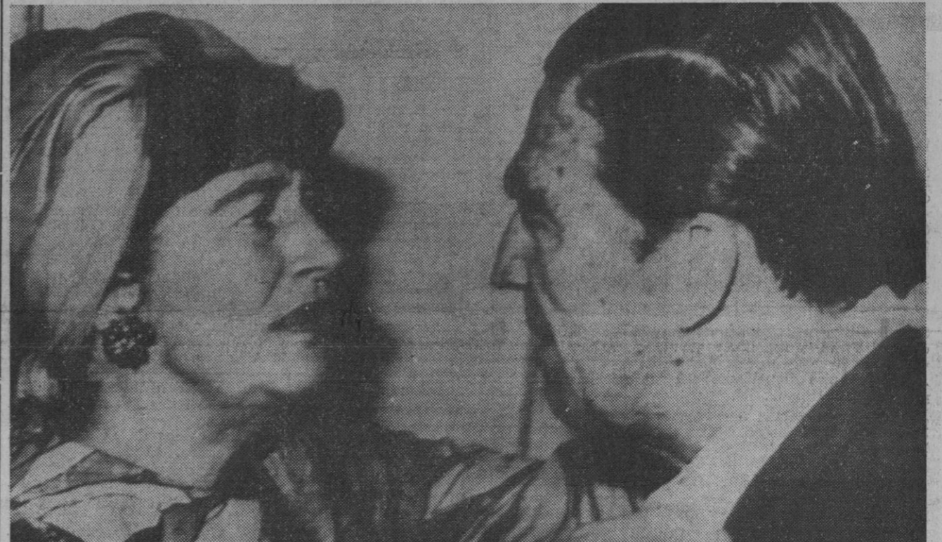
Río de Janeiro.—La esposa del embajador de los Estados Unidos en Río, Charles B. Elbrick, abraza a su marido a la llegada de éste a la Embajada, tras haber sido puesto en libertad por sus captores como cumplimiento del trato que hicieron con las autoridades de Río para la libertad de quince presos políticos.—(Telefoto Europa Press)

Pamplona, 8.—115.000 pesetas se ha pagado en Valcarlos por un puesto para la caza de palomas. La subasta de los puestos alcanza precios muy elevados, debido a la gran afluencia de cazadores nacionales y extranjeros.—Alfil.