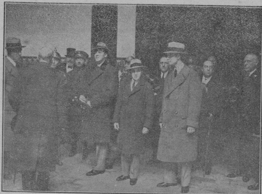
Barcelona.—Los Infantes en el patio de Capitanía General viendo las reformas que se están haciendo en dicho local.