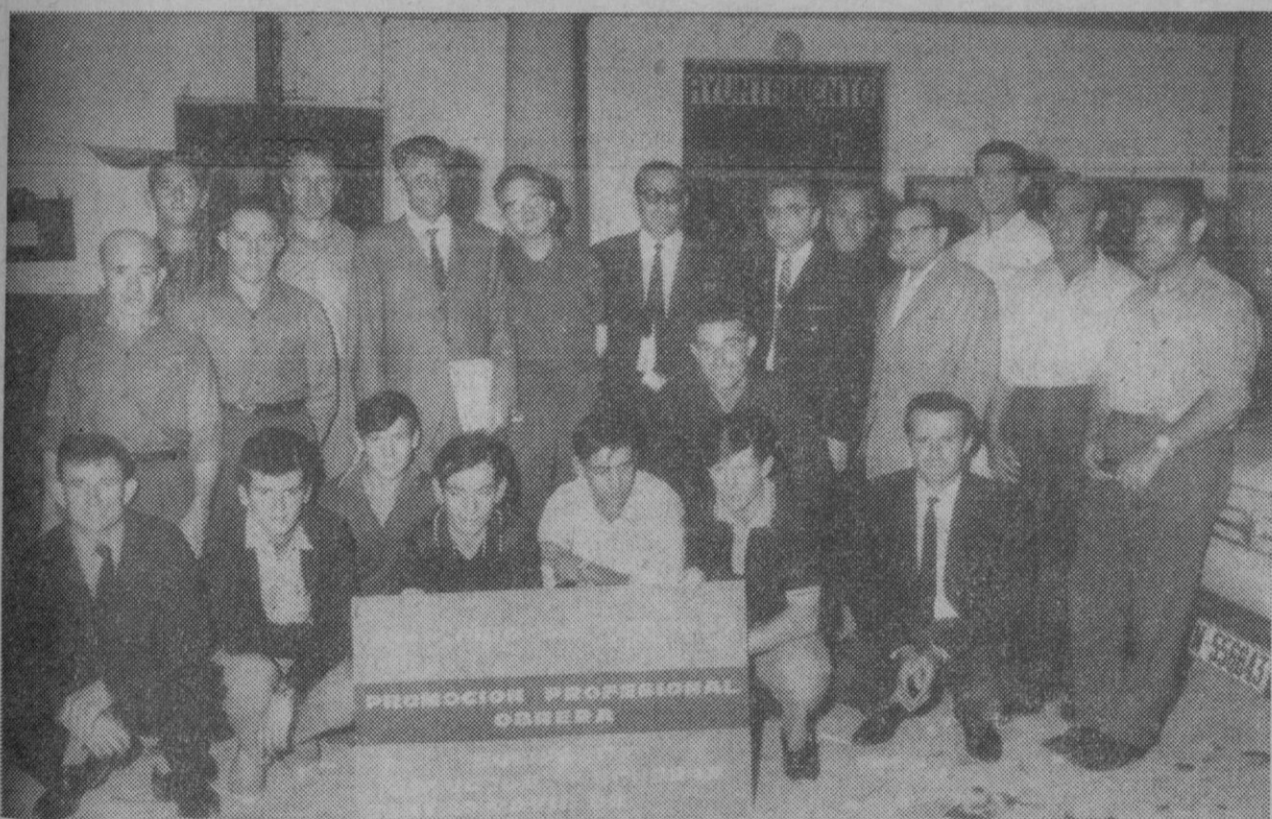
Alumnos y profesores del curso celebrado en Escalona del Prado.