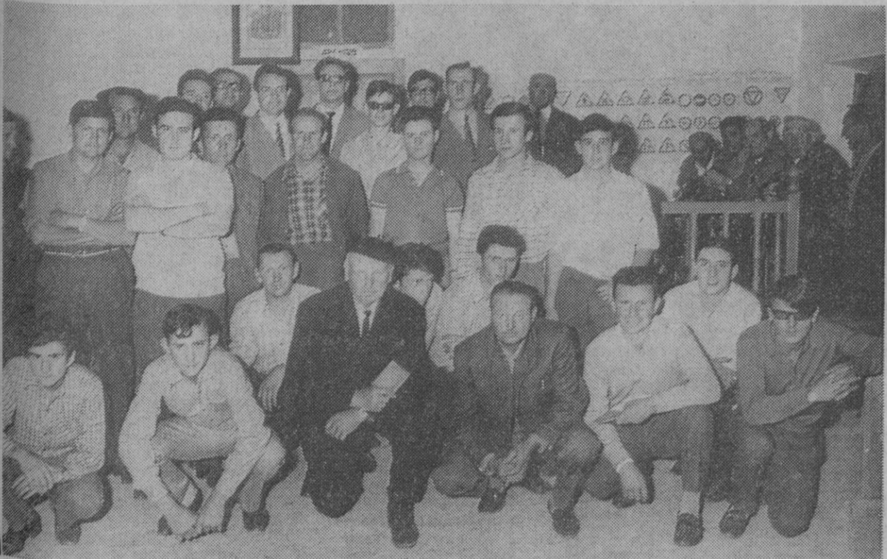
Alumnos del curso de Mozoncillo posan junto a sus profesores.

Escalona del Prado.—Se ha clausurado en esta localidad un curso de Ganadería, en la especialidad de vacuero-lechero, en el que han obtenido el correspondiente carnet dieciocho alumnos. El instructor del P. P. O. dirigió unas palabras agradeciendo la colaboración recibida del Ayuntamiento,