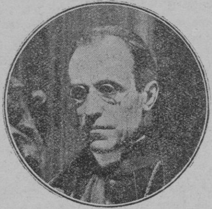
El Nuncio de S. S. en Berlín, Monseñor Paelli, que será nombrado Cardenal

pretensión que la de ser útil a quienes por no haber tenido interés, ocasión, lugar o medios de conocer la historia de su tierra natal, quieran ahora, avivada su curiosidad por la conmemoración de tal principal hecho, tener idea clara de lo que rememora y festeja".