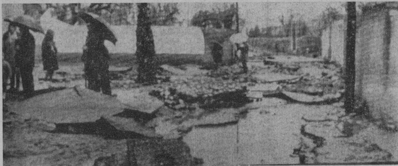
Saint Pargoire (Paris).—Las calles de esta ciudad del norte de Francia muestran los destrozos causados por las lluvias torrenciales caídas últimamente.—(Telefoto AP-Europa Press)

Buenos Aires, 25.—Un rayo cayó sobre la red de distribución eléctrica de Buenos Aires, dejó sin luz a esta ciudad durante más de hora y media.—Efe.