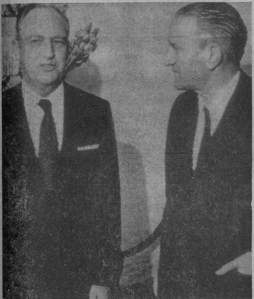
Washington.—El secretario de Estado norteamericano William Rogers durante la entrevista con el ministro español de Asuntos Exteriores, don Fernando María Castiella. Ambos trataron sobre las bases norteamericanas en España.

Efectivamente, el empleado del motel le dijo que le recordaba y le entregó los 325 dólares que tenía en la caja.—Efe.