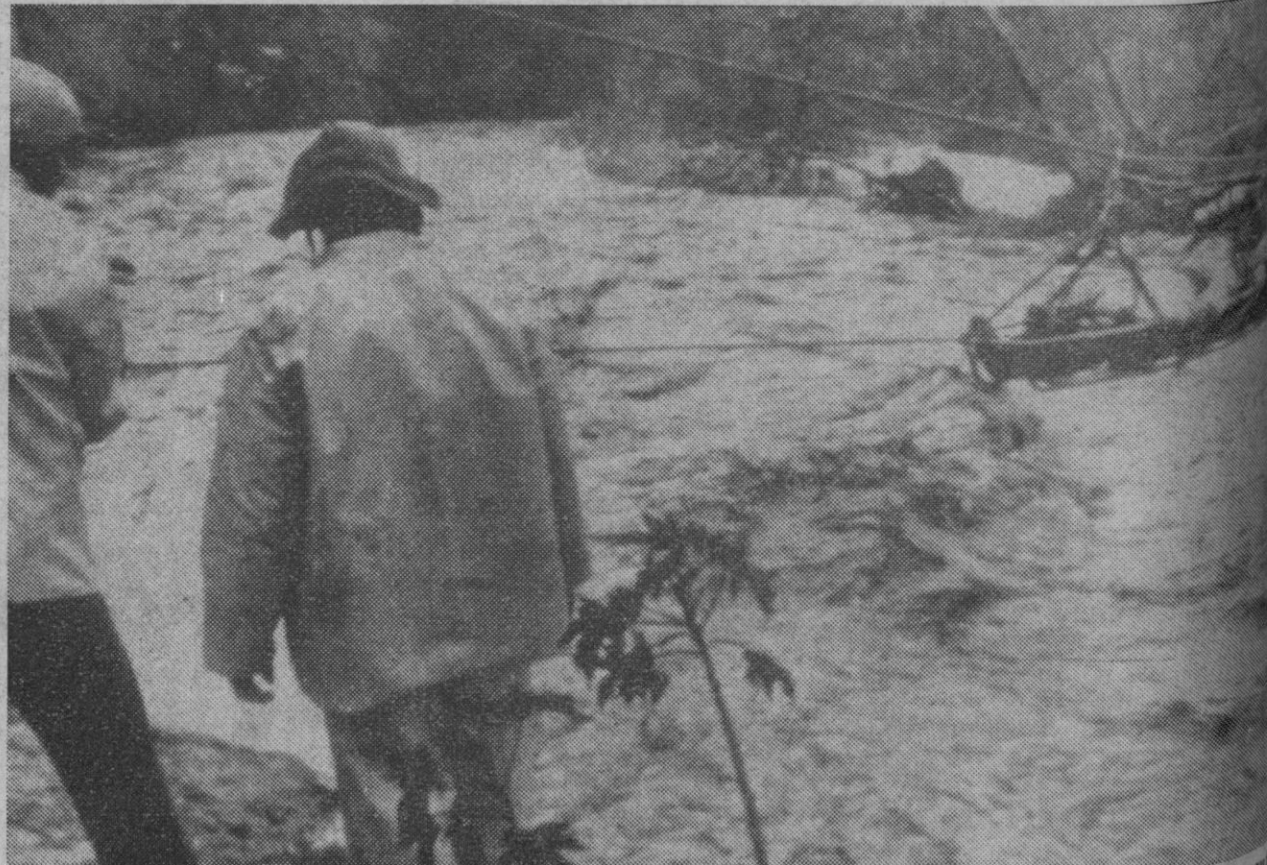
Los Angeles.—Hombres de los equipos de rescate tiran de la cuerda de la que pende una cesta de salvamento en la que han sido salvados dos pequeños. A consecuencia de las últimas tormentas de agua caídas sobre la zona se han registrado un sinnúmero de inundaciones. El número de víctimas es muy elevado y las pérdidas materiales se elevan a varios millones de dólares.

Nueva York, 28.—Por primera vez después de nueve días de torrenciales lluvias, salió ayer el sol en la zona de California, donde han muerto noventa personas a causa de esta racha de mal tiempo. Diez mil personas han quedado sin hogar a consecuencia de este temporal de lluvias, el más violento que se recuerda en la región desde hace treinta años. Las pérdidas materiales se evalúan en más de treinta millones de dólares.—Efe.