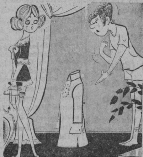
Mujer, en las camisas sólo se almidona el cuello...

EN TELEVISION puede estar seguro si es Westinghouse CASA SOLERA