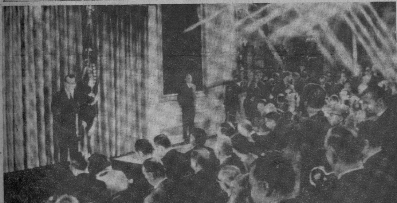
Washington.—El presidente Nixon contesta a las preguntas de los periodistas. Era la primera conferencia de prensa que como 37 presidente de los Estados Unidos daba Richard Nixon.