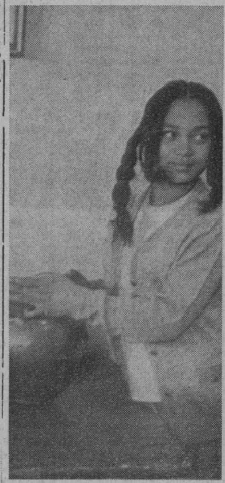
“La lloroncita”, protagonista de la película “Vacío en el alma”.

su cara. Tiene los ojos negros muy grandes y muy abiertos con expres-