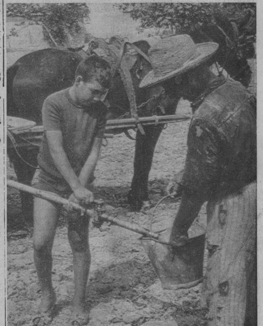
Alicante.—El agricultor que puede hacerlo, aprovecha las pestilentes aguas de las charcas salobres que se encuentran en la zona, para intentar salvar sus plantaciones de alcachofas. Pero incluso esto es difícil en la vega alicantina. Más de dos meses dura ya el problema de la sequía, y a causa de la falta de agua más de veinte mil hombres se encuentran en paro forzoso. Las condiciones toman ya aires de catástrofe pública.

En dicha casa se almacenaba gran cantidad de clorato potásico, producto que se emplea para fabricar explosivos, cohetes, etc., según ha informado la agencia PNS. La fuerza de la explosión destruyó diez casas.—Efe.