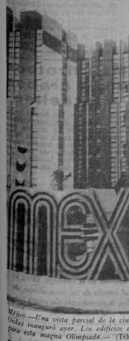
Méjico.—Una vista parcial de la ciudad olímpica "Miguel Hidalgo", que el presidente mejicano Gustavo Díaz Ordaz inauguró ayer. Los edificios alojarán a los atletas de ciento diecinueve países llegados de todo el mundo para esta magna Olimpiada.—(Telefoto Ap-E. Press)

Nuevo laboratorio fotográfico electrónico. De un mal cliché una buena ampliación. 50 años de práctica