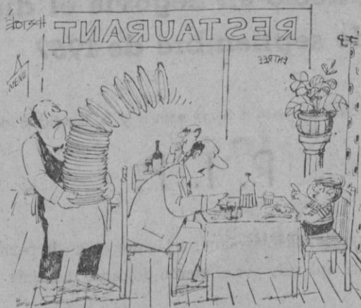
—En el restaurante no se habla con la boca llena...

En lavadoras superautomáticas puede estar seguro si es Westinghouse CASA SOLERA