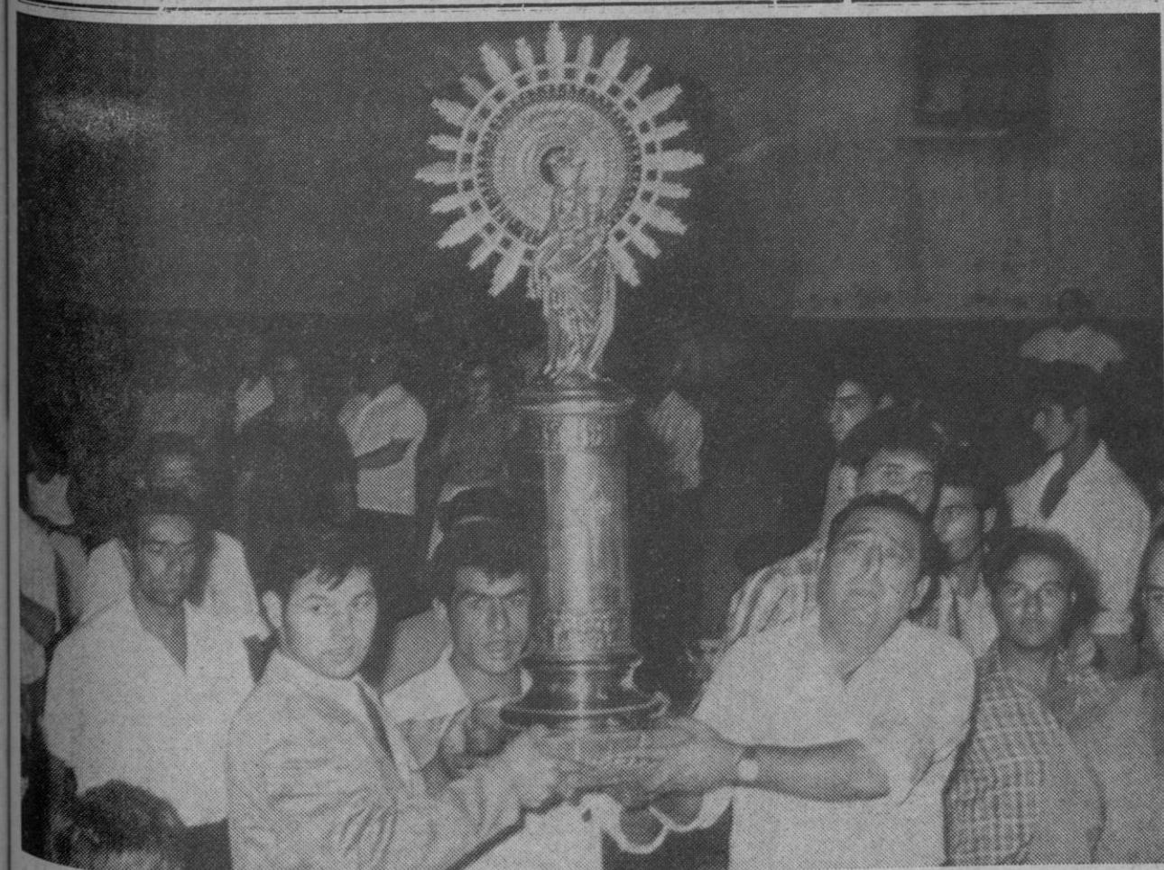
Zaragoza.—Los gitanos aragoneses portan la virgen del Pilar para llevarla junto a las patronas de los demás países que se hallan en Zaragoza llevadas por los gitanos de todo el mundo que se encuentran en la ciudad para asistir a la magna peregrinación que allí tiene lugar.

La operación de próstata se ha realizado con toda normalidad y los doctores que la han realizado esperan un pronto restablecimiento del ilustre prelado.—Cifra.