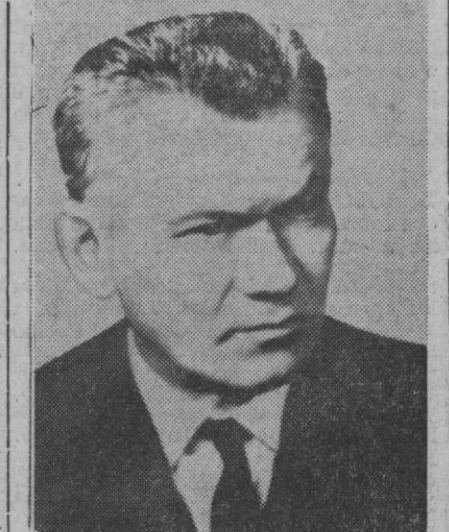
Josef Smrkovsky, presidente de la Asamblea nacional checoslovaca, que ha rehusado ratificar los acuerdos de Moscú.

Mientras tanto se han tomado especiales precauciones de Policía en Saigón durante los últimos días, con el fin de evitar un ataque por sorpresa durante el día de hoy, que conmemora el 23 aniversario de la decisión del presidente norvietnamita Ho Chi Minh de liberar el Vietnam del control francés, y el "Día de la Independencia" de los vietcong.—Efe-Reuter.