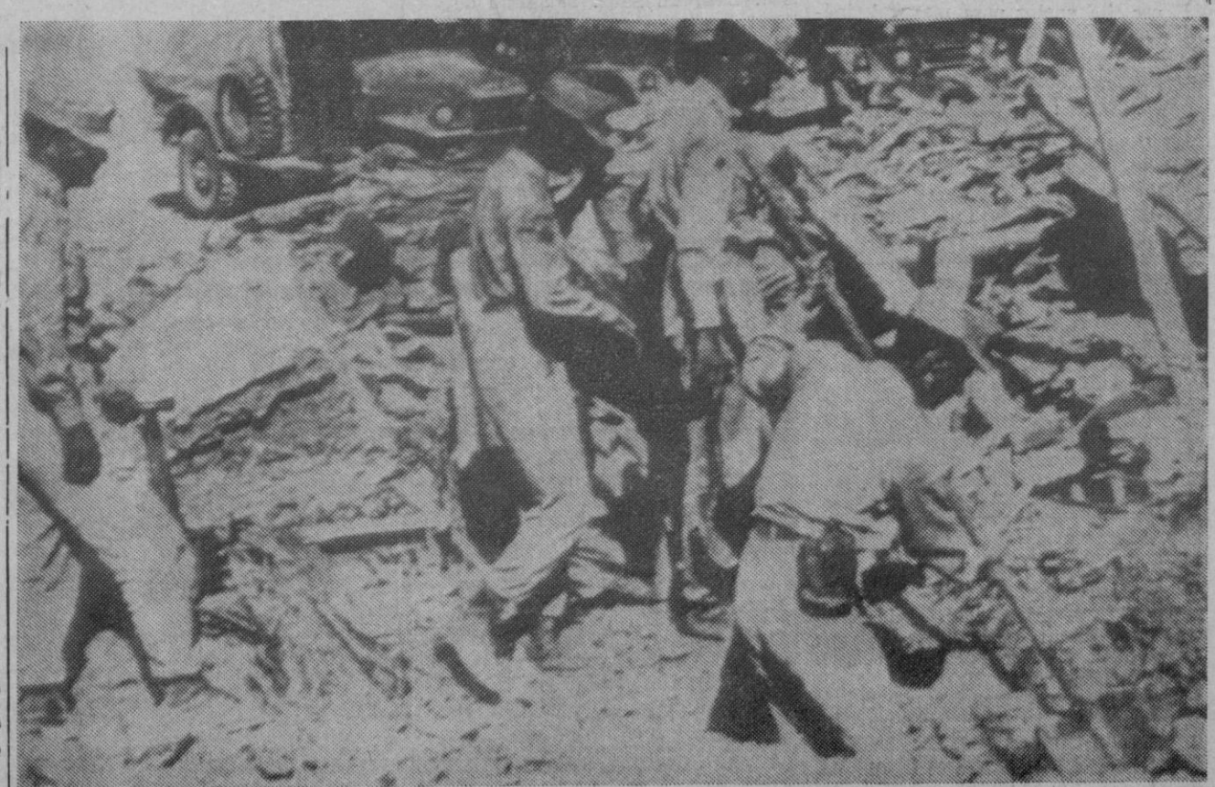
Teherán.—Trabajadores de rescate, buscan entre las ruinas dejadas por el terremoto, restos de vida de alguna de las tres mil personas que fueron sepultadas a consecuencia del mismo, en la zona al noreste de Persia.

Sarajevo (Yugoslavia), 2.—Un temblor de tierra sacudió en la madrugada de ayer a esta ciudad yugoslava de 250.000 habitantes, aunque parece que no ha producido ni desgracias ni daños.