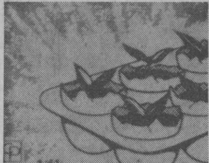
Plantas difíciles de cultivar

Si desea plantar algunas semillas delicadas que no suelen brotar al exterior, busque una vasija no muy honda y, después de plantar las semillas, cúbralas con un plástico. Este servirá de invernadero y le permitirá ver fácilmente los brotes y regar al mismo tiempo la tierra con semillas o las pequeñas plantas, a su debido tiempo. Cuando llegue el momento oportuno, páselas a la maceta que tiene destinada o al suelo.