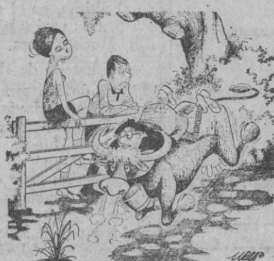
—Déjala. Un poco de ejercicio no le vendrá mal.