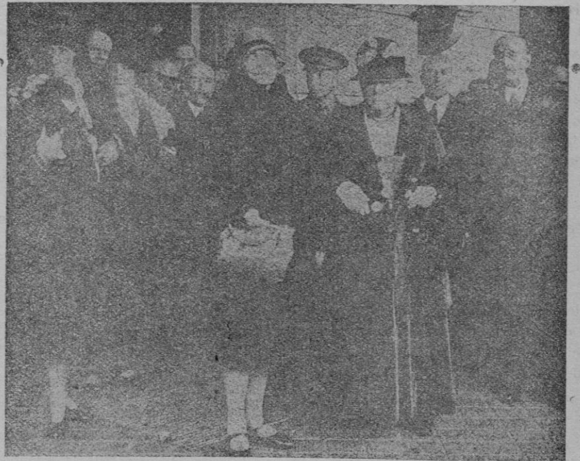
Las Infantas doña Isabel y doña Eulalia a la llegada de esta última a la Exposición de Barcelona

El señor Cambó ha demostrado interés por cierto asunto de esta isla, según nuestros informes."