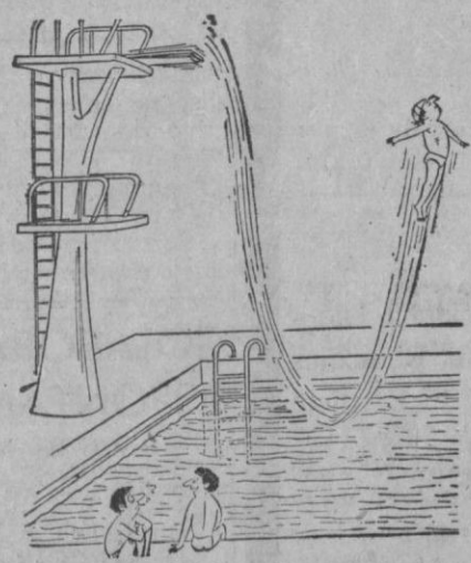
—Es un antiguo piloto de caza

al contado y regalamos seis cargas de gas calor gratis para todo el invierno CASA SOLERA