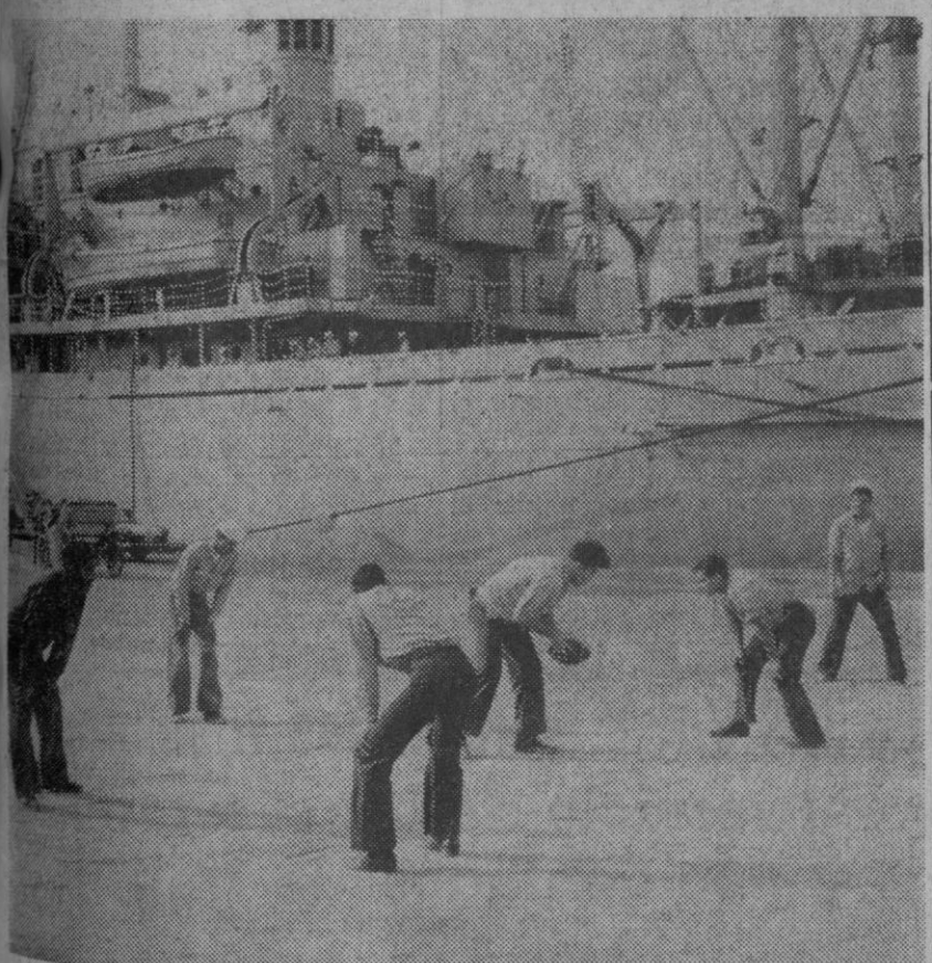
Palma de Mallorca.—Los marinos de varios barcos norteamericanos anclados en el puerto, aprovechan un momento de descanso para practicar el rugby, su deporte favorito. Un lugar en el muelle les sirve a tal efecto, a falta de un apropiado terreno de juego.

La señora Carnaíba, de cuarenta y cinco años, se encuentra en perfecto estado, así como su último hijo.—Efe-Upi.