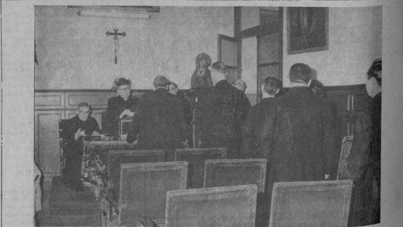
Madrid.—Varios sacerdotes, formados en fila, esperan turno para depositar el voto durante las elecciones internas para vicarios pastorales de zona. Preside la mesa el párroco de San Jerónimo el Real.

La autoridad judicial ha ordenado que el citado sacerdote permanezca privado de libertad en un lugar señalado por el obispo de la diócesis.—Cifra.