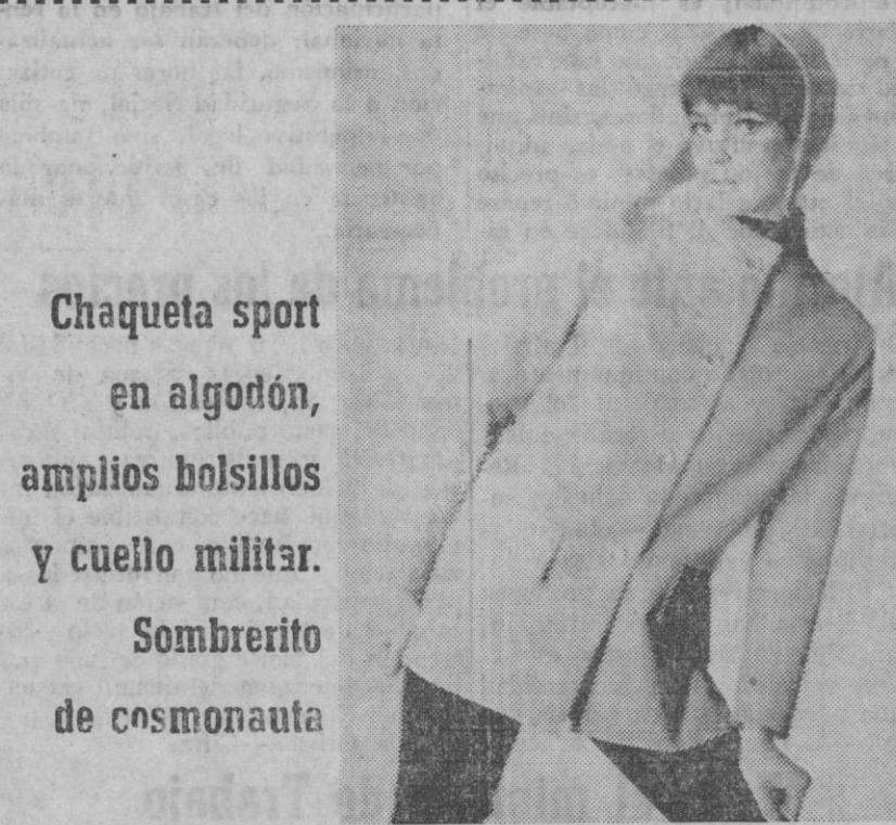
Chaqueta sport en algodón, amplios bolsillos y cuello militar. Sombrerito de cosmonauta

El estilo de los modelos femenines se caracteriza por los hombros estrechos, busto sin importancia y línea evasé hacia el bajo. La ejecución de las espaldas se caracteriza por martingalas, pespunte y aberturas. La línea deportiva, para los modelos femenines, se orienta con frecuencia hacia chaquetas de tipo amazona y blusones.