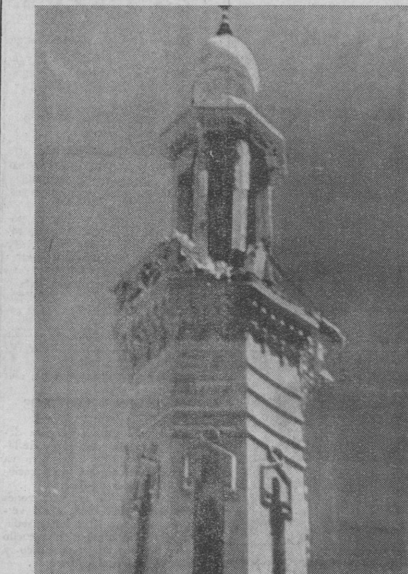
Suez.—En la parte de arriba de esta bella torre árabe pueden apreciarse los destrozos producidos por los proyectiles israelíes en uno de sus últimos ataques.—(Telefoto AP-Europa Press)

Los afectados continúan presentando incesantes denuncias en la Comisaría de Chamberí, tan pronto como se enteran de la verdad de los hechos. Y esto cuando hace tan sólo unos días que se descubrió el caso de la «Nueva Esperanza», que tanto ha dado que hablar.—(Europa Press).