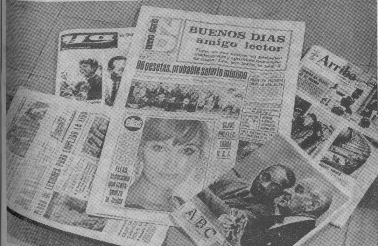
Madrid.—Hoy ha salido el primer número de un nuevo periódico matutino. "Nuevo Diario" es el primer periódico de información general que se publica en Madrid desde el año mil novecientos treinta y nueve. Larga vida al nuevo diario.