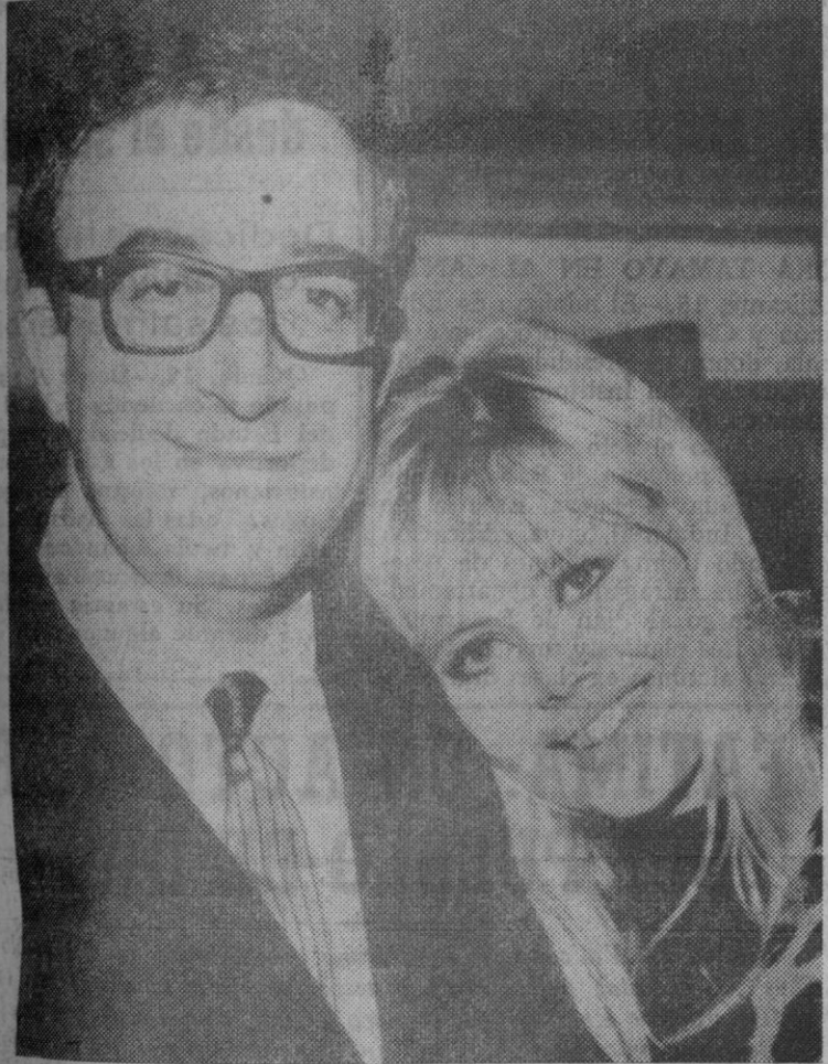
El famoso actor británico Peter Sellers aparece aquí acompañado de su joven esposa Britt Ekland.

sar con Bill Wills, que vive en Suiza y administra el enorme imperio financiero de Sellers.