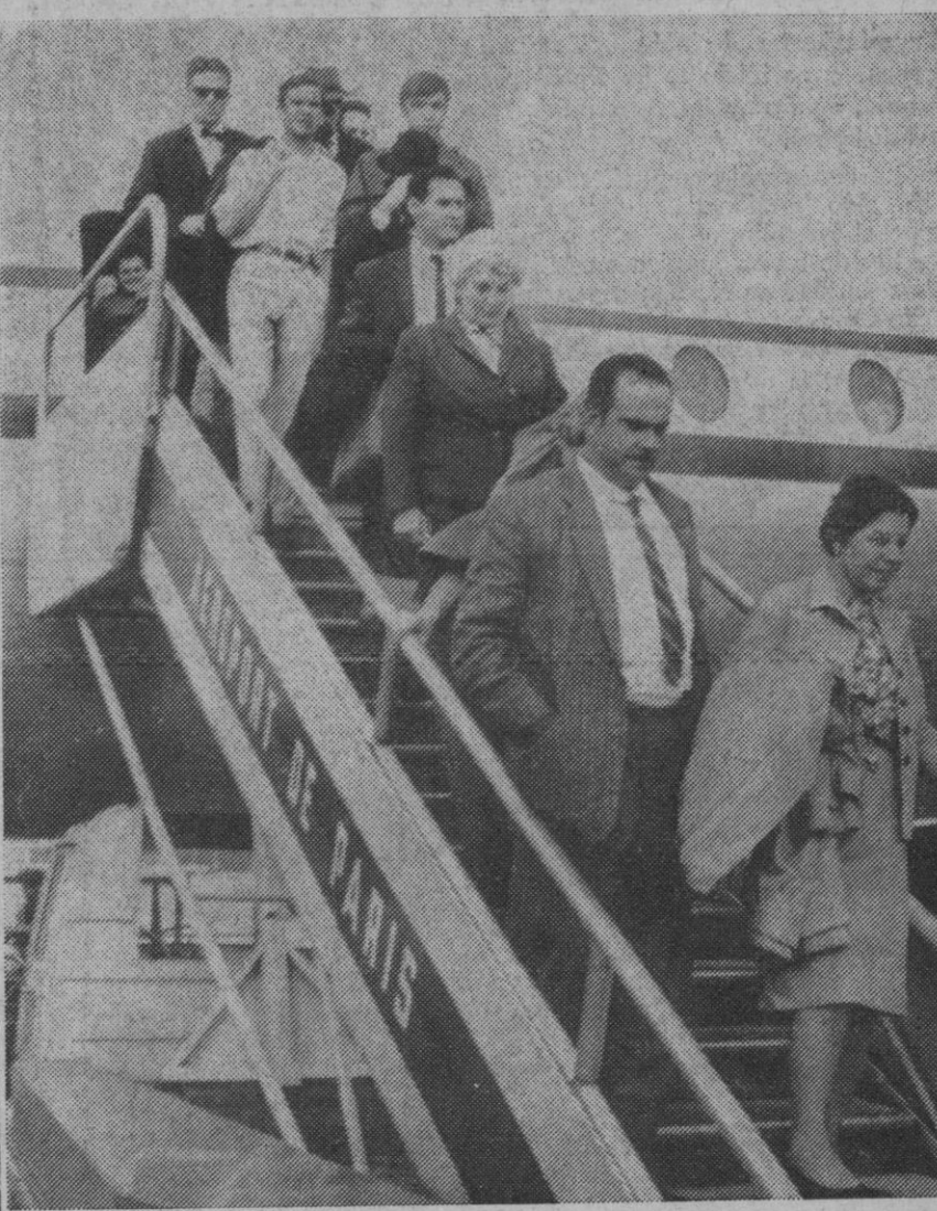
Paris.—Con España como destino de su viaje, un grupo de cubanos llega al aeropuerto de esta ciudad, procedente de La Habana a bordo de un avión checo.

Yakarta, 15.—Al menos 37 personas han perecido y 30 mezquitas, docenas de casas y edificios gubernamentales se han desplomado a consecuencia del seísmo de cinco segundos de duración que se ha registrado en la ciudad de Madjene, al sur de Las Cebeles, el pasado martes, según informa hoy la gaceta de las fuerzas armadas indonesias.—Efe-Reuter.