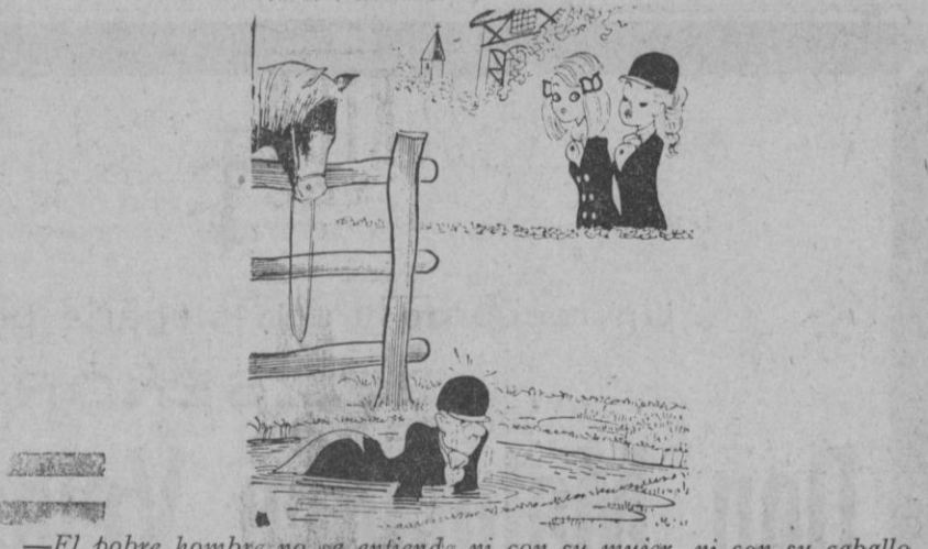
—El pobre hombre no se entiende ni con su mujer, ni con su caballo.

mejor que la realidad 18 meses para pagar Distribuidor exclusivo Casa SOLERA