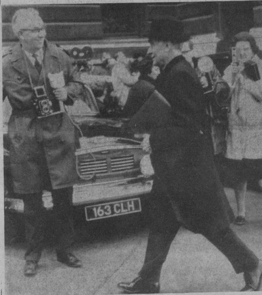
Londres.—Entre la expectación de periodistas y público congregado ante el Foreign Office, el embajador español en Gran Bretaña, marqués de Santa Cruz, llega para conversar con el ministro británico de Estado sobre la decisión de su Gobierno de suspender las negociaciones hispano-británicas sobre Gibraltar.

Comité de Descolonización de la O. N. U. está moralmente del lado español. Por si fuera poco, los Estados Unidos, Francia, Alemania Federal, e, incluso, la O. T. A. N. son propicias a España, la cual demanda la prohibición de vuelos sobre el Campo de Gibraltar, en uso de su soberanía, por ello es arriesgado que Gran Bretaña recurra a la O. A. C. I.