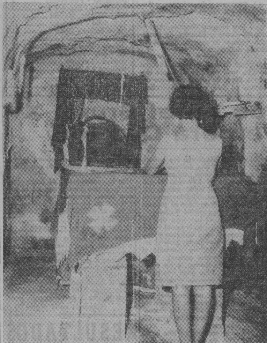
El Cairo.—Una mujer ora en la cripta de la iglesia de San Sergio, considerada la más antigua de Egipto, situada en El Cairo, en lo que en tiempos fue el barrio judío. Según la tradición la cripta fue uno de los lugares donde la Santa Familia y el Niño Jesús buscaron refugio y descansaron cuando marcharon a Egipto huyendo de Herodes.