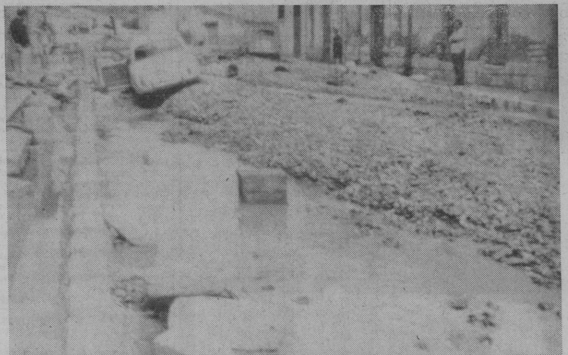
Alicante.—Aspecto de una calle alicantina tras la enorme tromba de agua que descargó el sábado. Los daños producidos por el temporal se calculan en veinte millones de pesetas. La calle acababa de ser pavimentada.

Noticias llegadas de Burgos dan cuenta de que, por otra parte, en las proximidades de Sargentos de La Lora se efectúan unos trabajos previos para instalar próximamente una torre de perforación que, según se asegura, sería la de mayor potencia entre las montadas hasta ahora.—Cifra.