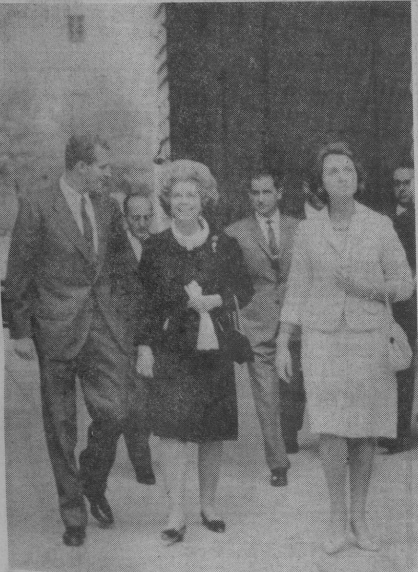
El Escorial.—La Reina Madre Federica de Grecia durante su reciente visita a la real basílica de San Lorenzo de El Escorial, acompañada por su hija la princesa Sofía y el príncipe Juan Carlos.

Madrid, 10.—La resolución de la Dirección General de Sanidad del ministerio de la Gobernación que dicta normas sobre reconocimiento de los cerdos sacrificados en domicilios particulares, determina que la temporada de sacrificio de los mismos terminará el 30 de abril de 1967.—Cifra.