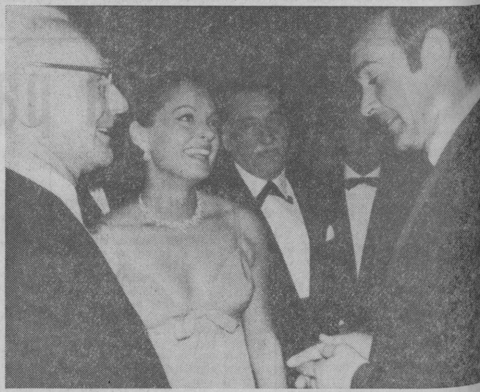
El presidente austriaco, Franz Jonas (izquierda) y el "007", Sean Connery, son presentados por la actriz Nadja Tiller, después del estreno mundial de la película de las Naciones Unidas "The poppy is also a flower" (La amapola es también una flor). Al fondo, el alcalde de Viena, Bruno Marek.

La Policía italiana ha alertado todos los puertos franceses de la Costa Azul, así como a la Interpol.—Efe.