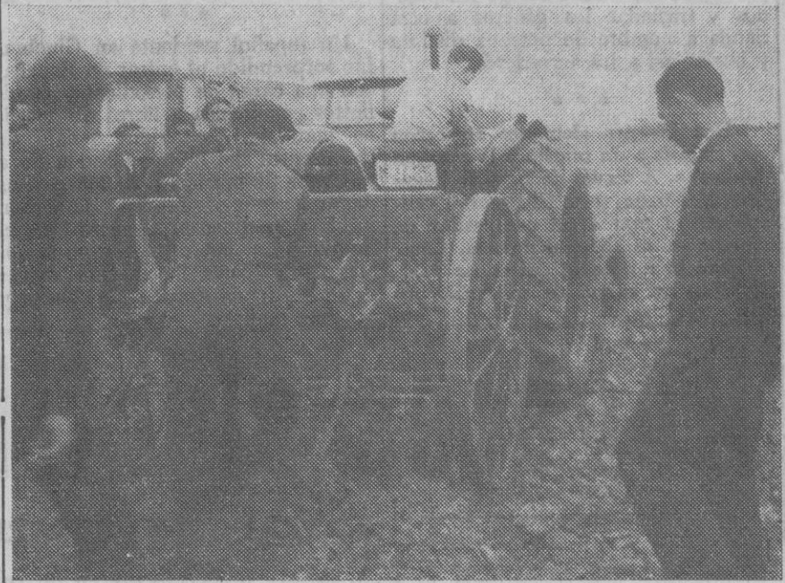
Después de la teoría, la práctica. Labores agrícolas en unas tierras. Lo aprendido de viva voz hay que aplicarlo ahora sobre la marcha.