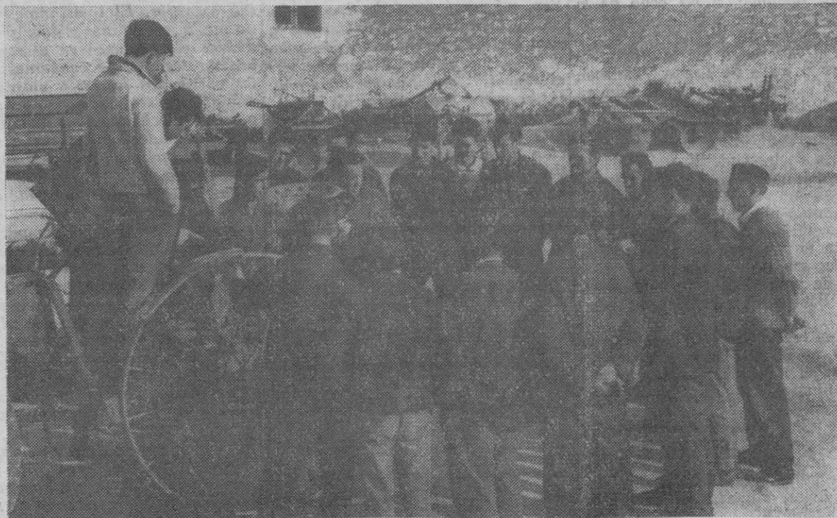
Atentamente, los alumnos siguen la explicación del monitor, junto a la máquina que les sirve de estudio.

Sobre un tractor han estado viendo problemas tras problema. El mo-