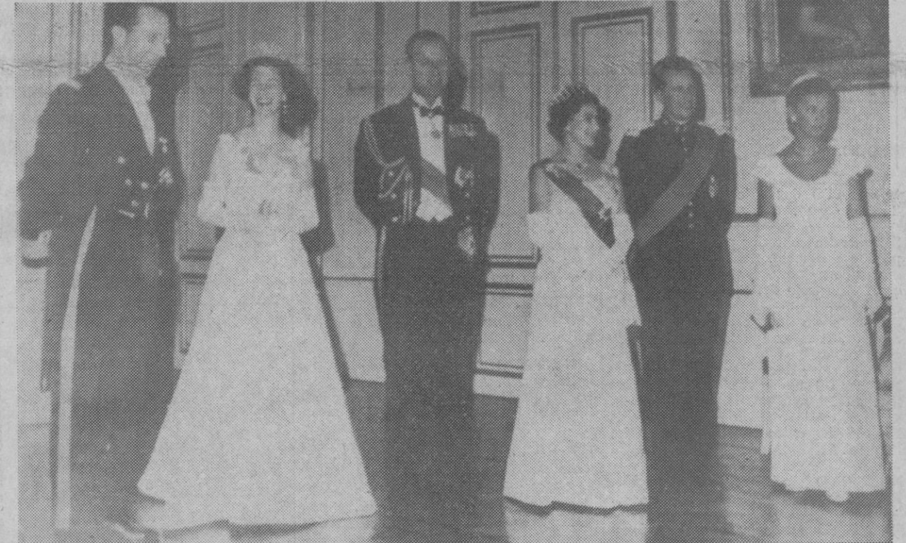
Bruselas.—El príncipe Alberto y la Reina Fabiola de Bélgica; el príncipe Felipe y su esposa la Reina Isabel de Inglaterra; el Rey Balduino y la princesa Paola de Bélgica, reunidos al comienzo de la recepción en honor de la soberana británica en el palacio de Bruselas.

Hong Kong, 10.—Viajeros procedentes de la China comunista han declarado hoy en Hong Kong que la noticia de la tercera prueba nuclear china ha sido festejada con gran júbilo en algunas ciudades de la China comunista por medio de desfiles y otras manifestaciones callejeras.—Efe.