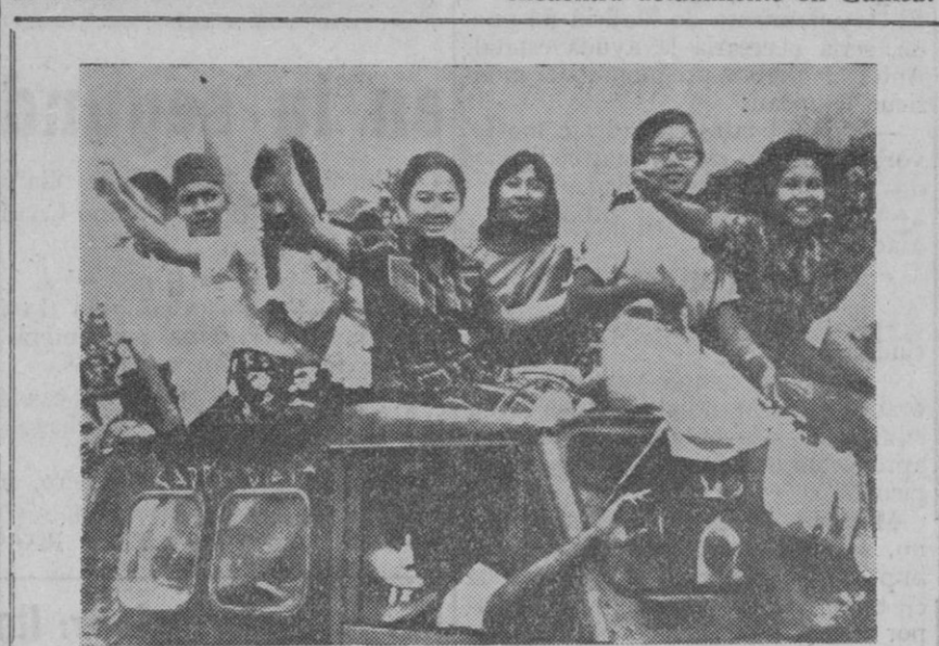
Yakarta.—Muchachas indonesias encaramadas en lo alto de los camiones contemplan con alegría a los soldados de la parada militar con motivo de la cesión de poderes de Sukarno.

encuentra todavía bajo la consigna de secreto.