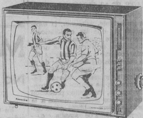
19 TE 395A

Distribuidor exclusivo: GALERIAS Sta. COLUMBA Azoguejo, 7 Tel. 18-10