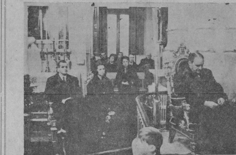
Madrid.—El ministro de Asuntos Exteriores, don Fernando María Castiella ha presidido, junto al embajador de Bélgica en España, los funerales en memoria de la Reina madre Isabel de Bélgica. Al mismo asistieron los príncipes Juan Carlos y su esposa Sofía, así como la totalidad de los embajadores acreditados en Madrid.

Gran Bretaña considera a Gibbs la única autoridad legal en Rodesia desde que se declaró independiente el 11 de noviembre.