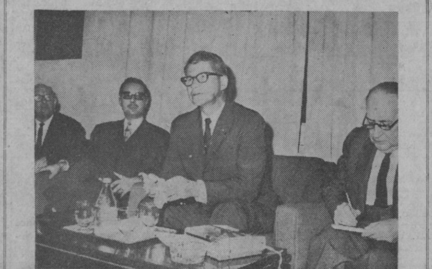
Se encuentra en España el secretario o ministro de Agricultura de los Estados Unidos, Mr. Orville L. Freeman. En Madrid ha celebrado una rueda de prensa con los informadores en el Club de Prensa de la capital de España. En la foto le vemos durante su reunión con los informadores.